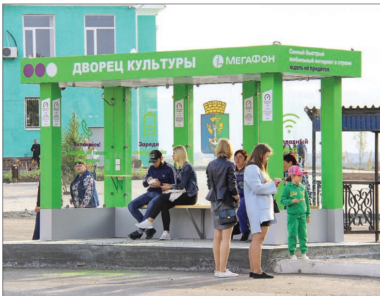
При разработке новых маршрутов общественного транспорта перевозчики и администрация стараются по возможности учесть мнение жителей / ФОТО ДВОРЦА КУЛЬТУРЫ

А с 15 сентября будет пущен автобусный рейс к электропоезду «Ласточка» до станции Выя (расписание находится в стадии согласования, с ним мы ознакомим вас в ближайшем номере и наших группах в соцсетях). Напомним, что по заказу Правительства Свердловской области РЖД ввела дополнительные маршруты. С 11 августа «Ласточка» курсирует между Екатеринбургом и Серовом с остановками на станциях ВИЗ, Верх-Нейвинск, Невьянск, Нижний