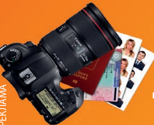
ФОТО НА ДОКУМЕНТЫ Редакция газеты «Время», ул. 40 лет Октября, 2А (здание администрации, 1 этаж, правое крыло) Тел.: 8 (34342) 2-79-62, 8 (950) 657-18-32