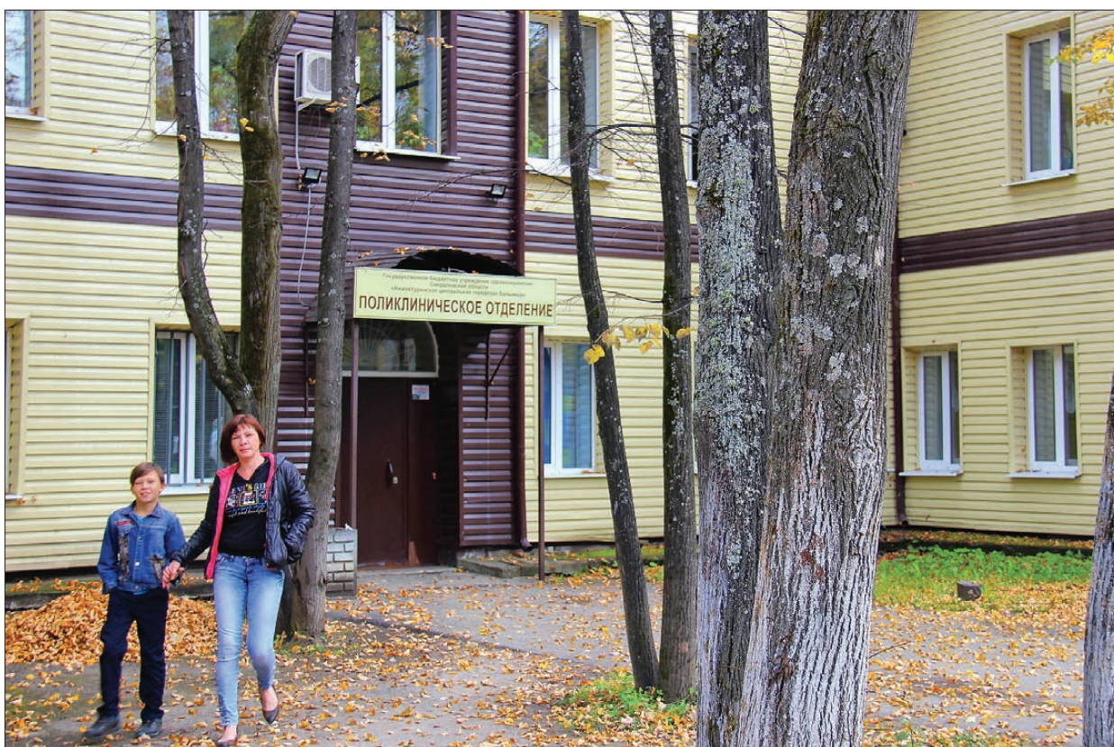
Центральную городскую больницу ждет немало перемен – над этим вместе работают региональный минздрав, администрация и Дума округа

С чего начнется ремонт, заменят ли рентгеновский аппарат, и куда делись женские врачи