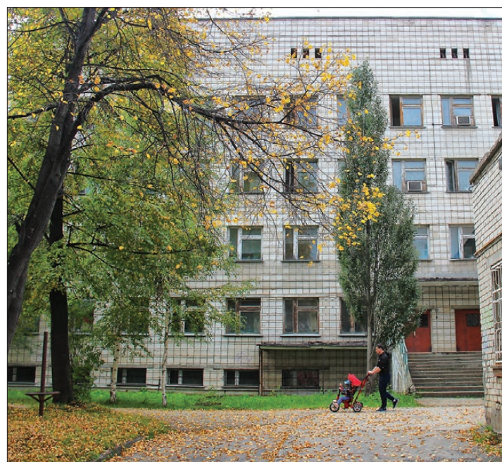
В 2020 году начнется капитальный ремонт 1 и 4 этажей хирургического корпуса

11 сентября состоялся аукцион на определение подрядчика по замене окон в хирургическом отделении Центральной городской больницы, и в скором времени здесь начнутся работы. О окнах будут заменены на всех этажах. На это выделено из областного бюджета 8,5 млн рублей в рамках государственной программы «Развитие здравоохранения в Свердловской области». Что еще в планах развития нашего здравоохранения?