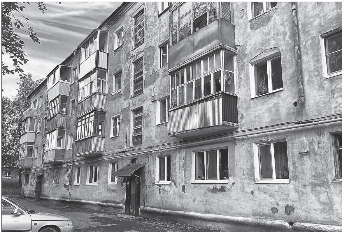
Пример жильцов этого дома лишний раз подтвердил, что нельзя опускать руки, что общественное мнение, внимание к месту, где живешь, настойчивость всегда побеждают

В день задержания сожительница торговца вернулась вечером в квартиру одна, прокричав на весь подъезд нецензурную брань в адрес соседей и угрозы. Ее-то не посадили! Но виновник переполоха так больше и не был замечен. А потом и вовсе в окна перестал гореть свет. Хозяина жилища так