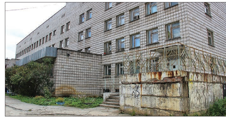
После капитального ремонта в операционной на четвертом этаже установят новое оборудование

· За счет средств местного бюджета планируется организовать