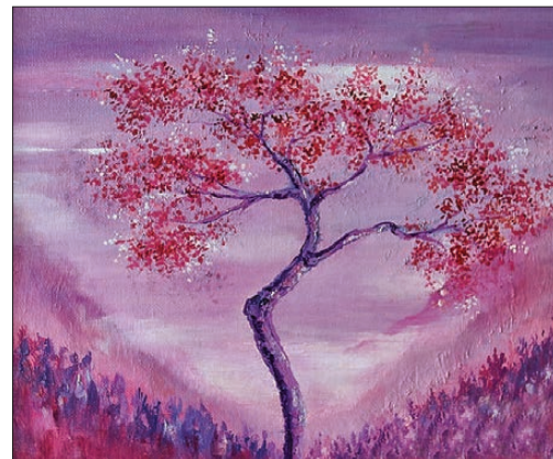
📷 Сейчас выставка работает в библиотеке Лесного, а скоро она будет организована в нашем музее