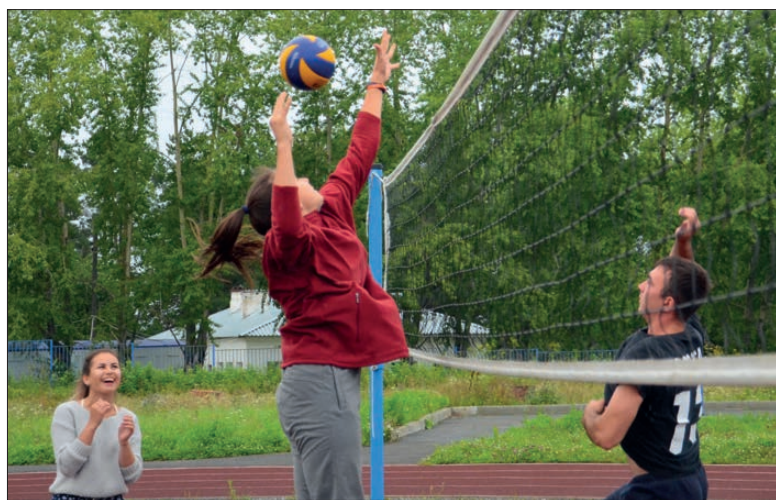
Подготовка идет полным ходом: тренировочная игра на центральном стадионе