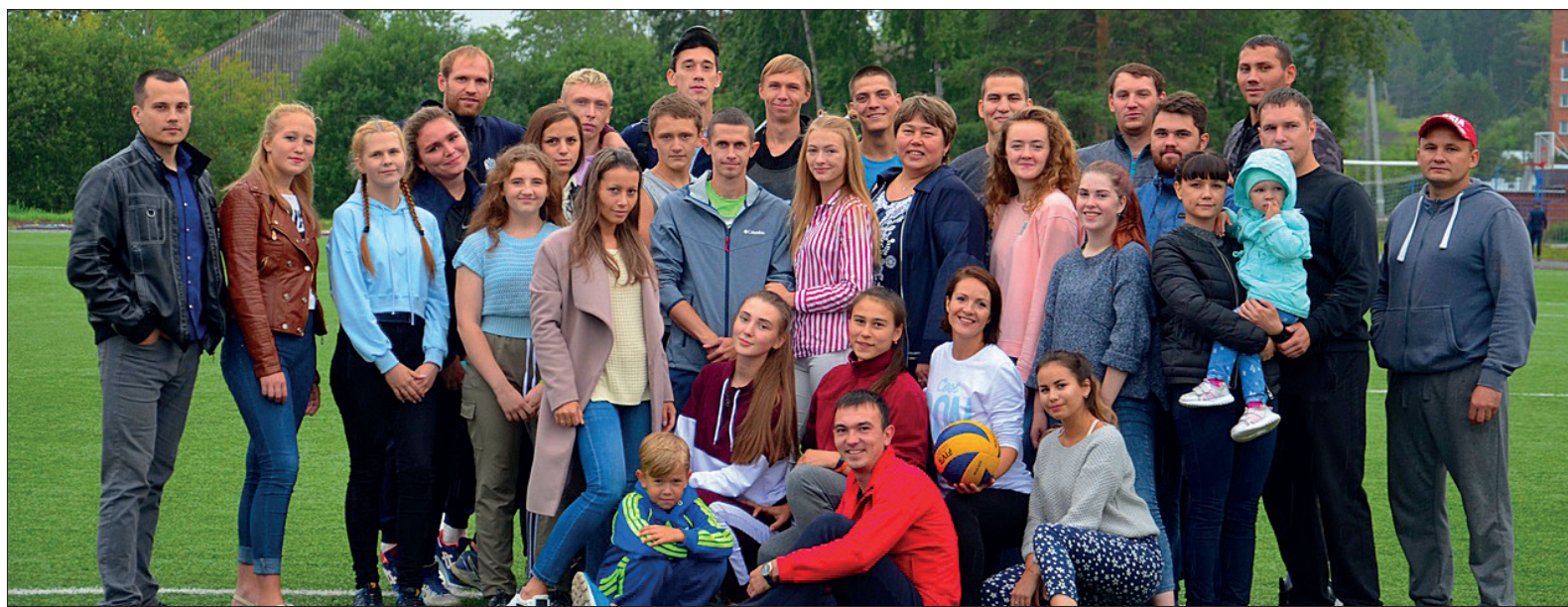
Волейболисты Нижнетуринского округа очень активны и умеют в короткие сроки организоваться на участие в любом нужном и полезном деле