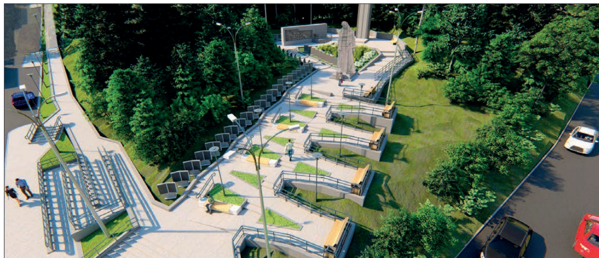
В 2020 году приоритетными в региональной программе благоустройства будут территории памятников и мемориалов, и у нашего муниципалитета большие шансы на включение в программу. Всего на реализацию текущих проектов строительства и благоустройства администрацией НТГО будет потрачено более 620 миллионов рублей

Газификация микрорайона «Западный» (старая часть города). Стоимость первого этапа газификации микрорайона – более 60 млн руб. На 2019 год в инвестиционной программе АО «ГАЗЭК» заложены 12 млн рублей, которые будут освоены в августе-октябре этого года. Доля участия муниципалитета – около 20 млн рублей.