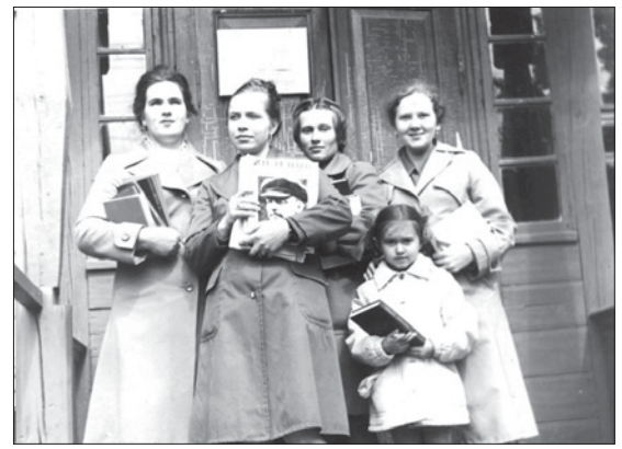
Узнали себя на этой фотографии? Срочно звоните по телефону +7 (900) 031-20-63: первый получает приз!

Наш конкурс продолжается. Делайте друг другу сюрпризы, приносите свои снимки в редакцию и ждите, кто первым узнает себя на них. А если вы купили нашу газету и узнали себя на этой черно-белой фотографии, срочно звоните по телефону +7 (900) 031-20-63: первый получает приз!