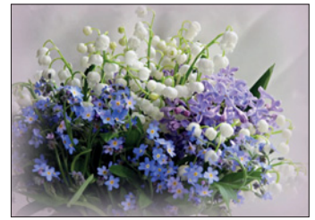
Люди, рожденные в мае, тонко чувствуют других, умеют сопереживать и сочувствовать, они надежные и верные друзья