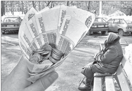
Интересует тема перерасчета пенсий? Обращайтесь только в Пенсионный фонд.

По заявлению осуществляется перерасчет, когда пенсионер приносит дополнительные документы о стаже, заработке, иждивенцах, либо хочет выбрать другой вариант пенсионного обеспечения (например, перерасчет пенсии может быть выгоден в случае совпадения по времени периодов работы и периодов ухода за детьми до достижения ими возраста 1,5 лет; либо для пенсионеров,