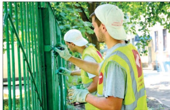
Работать детям можно с 14 лет, но только с согласия родителей

– Законодательное регулирование трудоустройства ребят старше 14 лет довольно жесткое, существует масса ограничений по безопасности и условиям труда. Во-первых, учащийся может работать строго в свободное от основной учебы время, да и по продолжительности рабочего дня существуют ограничения: с 14 до 16 лет – не более пяти часов в день, с 16 до 18 лет – не более