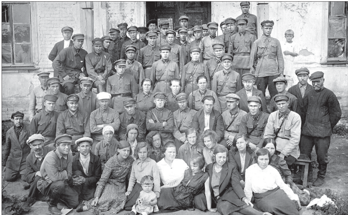
Командный, строевой и обслуживающий состав Нижнетуринской тюрьмы. ОМЗ. УНКВД. 22.07.1935 год

Письма с фронта написаны карандашом. Какие-то из них в конвертах, какие-то на почтовых открытках, а большинство – обычные фронтовые треугольники. Бумага для писем такая, какая уж нашлась в боевых условиях. Ничего удивительного для нас, сотрудников музея. Вот только адрес примечательный. А так – письма как письма. Но совсем необычно их содержание, проверенное военной цензурой, так как кое-где небрежно