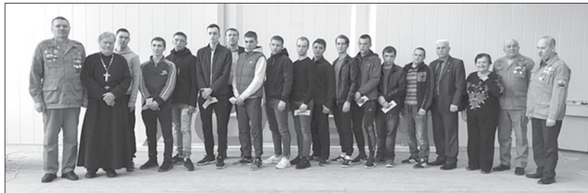
Проведение Дня призывника стало доброй традицией в Нижней Туре

С напутственным словом к будущим солдатам обратились заместитель главы по связям с административными органами и общественными