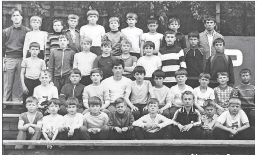
1987 год. Общекомандное фото клуба «Старт»