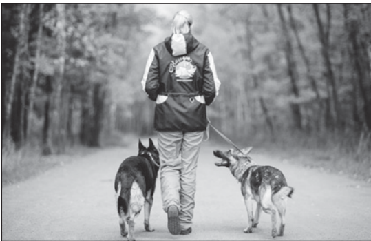
Места выгула определяют органы местного самоуправления