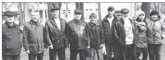
Нижнетуринцы пришли отдать дань уважения подвигу, который совершили наши земляки в 1986 году в далеком Чернобыле

быльской АЭС, прошли практически во всех муниципалитетах Свердловской области. Так, в Екатеринбурге состоялось торжественно-траурное мероприятие с митингом и возложением цветов, в котором приняли участие представители органов власти, ветераны, студенты, кадеты, жители и гости города. Всего в Свердловской области проживают более 5 тысяч человек, пострадавших вследствие чернобыльской катастрофы.