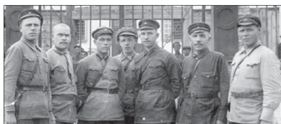
Административная часть Нижнетуринской колонии. 1932 год

Фронт стремительно продвигается на запад, а с ним и Иван со своей «Катюшей». Из писем от 08.09–26.12.1943 г.: «Пишу на ходу. Вот движемся вперед. Нужно быстрее освободить Донбасс. (...) взяли Таганрог (...) деревни все немец пожог, и люди живут в землянках (...) я кушаю арбузы, дыни, вишни