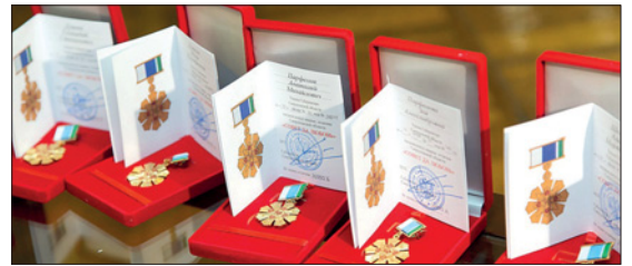
На сегодняшний день в Нижнетуринском округе знаком отличия «Совет да любовь» отмечены 178 супружеских пар

и номером банковского счета для перечисления средств. А далее управление выходит с ходатайством в Министерство социальной политики Свердловской области о награждении заявителей. Подачу заявления и документов можно осуществить и через многофункциональный центр пре-