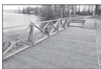
Горожане надеются, что скоро на набережной появится освещение и камеры видеонаблюдения