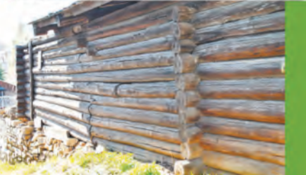
Дома на улице строили в два этажа