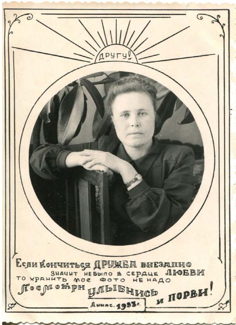
Каждую фотографию в те годы делали с душой.

Чтобы выбраться из деревенской бедности, на Динас девушка приехала в 1952 году. Здесь, как она