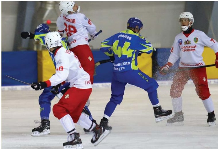
Почти футбольная борьба за верховой мяч.