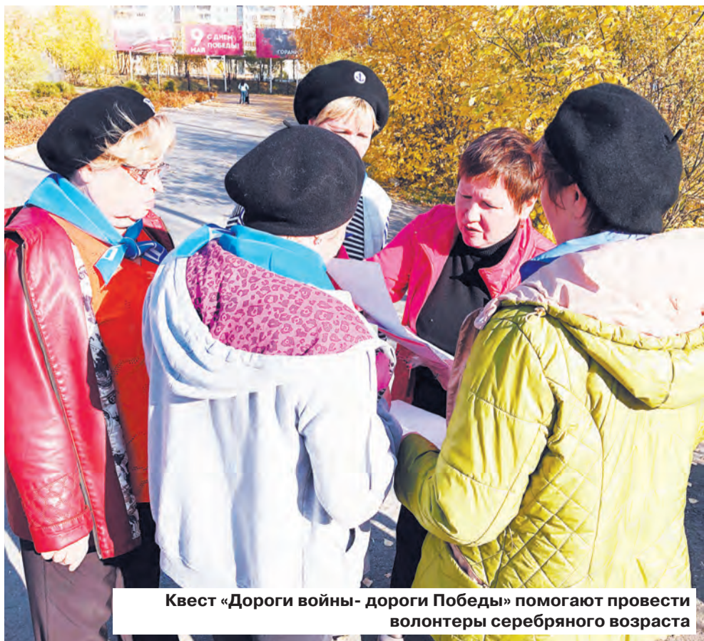
Квест «Дороги войны- дороги Победы» помогают провести волонтеры серебряного возраста