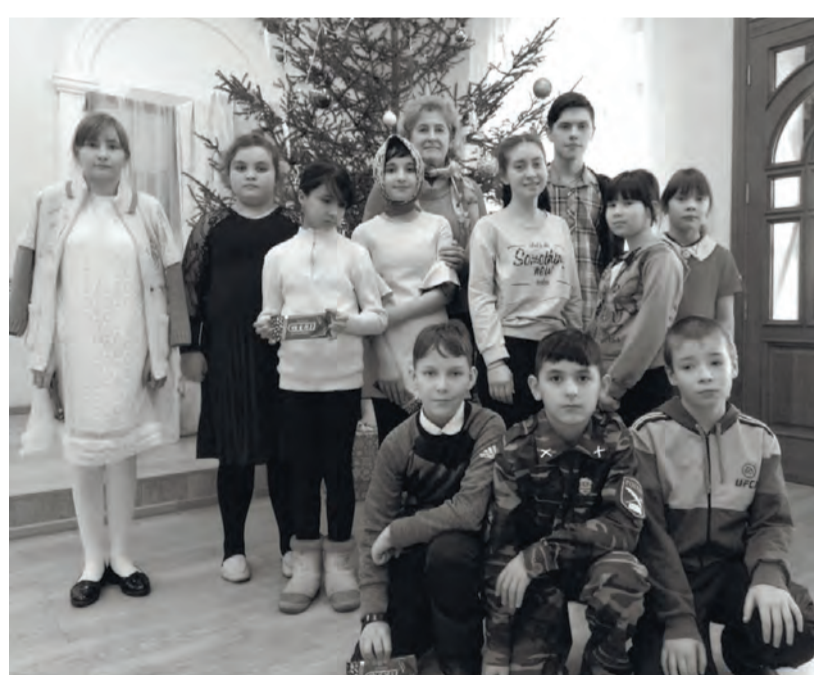
● Участники поездки

Но в «Царском» центре праздник на этом не закончился. Дети сами попробовали стать артистами. Как и было заведено в царской семье - в праздничном выступлении принял участие каждый. С удовольствием современные мальчишки и девчонки играли в старинные салонные и весёлые народные игры, учились танцевать народный танец «Улица», по окончании праздника всех ожидали приятные