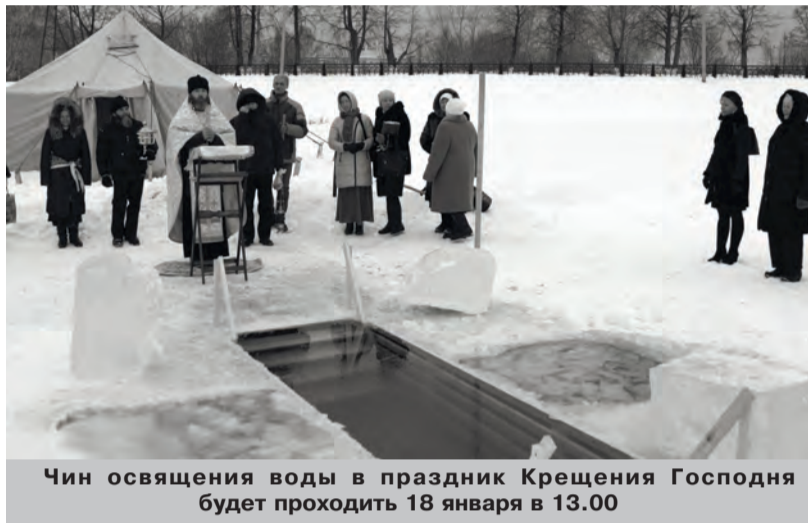
Чин освящения воды в праздник Крещения Господня будет проходить 18 января в 13.00

Приближается один из самых главных христианских праздников - Крещение Господне. По традиции, в этот праздник проходит чин освящения воды и Крещенские купания - о том, как и где они пройдут в нашем посёлке, читайте в материале ниже