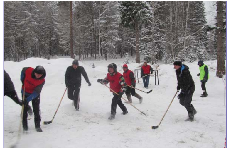
Открытие зимнего сезона, 2016 год. «Изюминкой» стал хоккей в валенках.

На следующую субботу, 14 декабря, запланирован спортивный праздник. На стартовой поляне ветераны, заводчане, школьники дружно откроют зимний сезон.