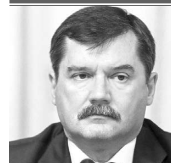
Александр Нерадько, руководитель Федерального агентства воздушного транспорта

— В рамках национального проекта «Комплексный план развития магистральной инфраструктуры» мы расширяем сеть региональных маршрутов, создаем условия для прямых полетов без пересадок в Москве. Существенно вырос объем субсидирования авиамаршрутов, и их количество увеличивается. Поставлена задача к 2024 году реконструировать 68 объектов в 66 аэропортах. Модернизация инфраструктуры возможна только при объединении ресурсов федеральных органов исполнительной власти, региональных властей и бизнеса.