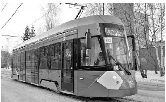
Из Екатеринбурга в Челябинск привезли односекционный вагон, который планируют испытывать в течение месяца.

В Челябинске проходит тестовые испытания новый трамвай Уралтрансмаша. Напомним, осенью 2019 года с подобной миссией в столицу Южного Урала прибыла машина Усть-Катавского вагоностроительного завода, но быстро сломалась. Тогда «РГ» высказала мнение «На обгон по рельсам» от 17.10.2019, что логично попробовать в эксплуатации продукцию другого уральского производителя, чтобы вагоны конкурентов соревновались в реальных условиях. И Уралтрансмаш выразил готовность предоставить для тестирования опытный образец. Усть-катавские вагоностроители после неудач своего трамвая заявили, что он требует улучшенного путевого хозяйства и контактной сети. Екатеринбургцы, напротив, подчеркивали, что для их машины реконструкция инфраструктуры не требуется. Но неспроста в ходе тестовой эксплуатации постигла и их участь: из-за сбоя электроники он остановился прямо у здания областного правительства, второй раз за неделю встал на проспекте Победы и был отбуксирован в депо. Впрочем, на Уралтрансмаше «РГ» сообщили, что подобные мелкие сбои в процессе обкатки — нормальное явление. Отметим, ставки в гонке по челябинскому рельсам высоки: на обновление парка область рассчитывает получить более двух миллиардов рублей из бюджета РФ, а также потратить свои деньги.