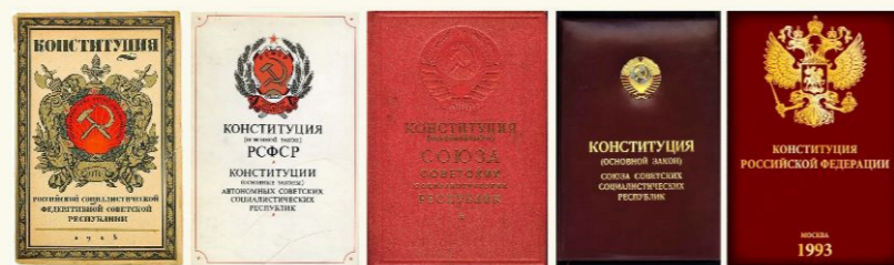
1918 г. Принята V Всероссийским съездом Советов на заседании от 10 июля 1918 года 1925 г. Принята XII Всероссийским съездом Советов от 11 мая 1925 года. 1937 г. Принята постановлением VII чрезвычайного Всероссийского Съезда Советов рабочих и крестьянских депутатов от 21 января 1937 года. 1978 г. Принята на внеочередной VII сессии Верховного Совета РСФСР девятого созыва 12 апреля 1978 года 1993 г. Принята всенародным голосованием 12 декабря 1993 г.