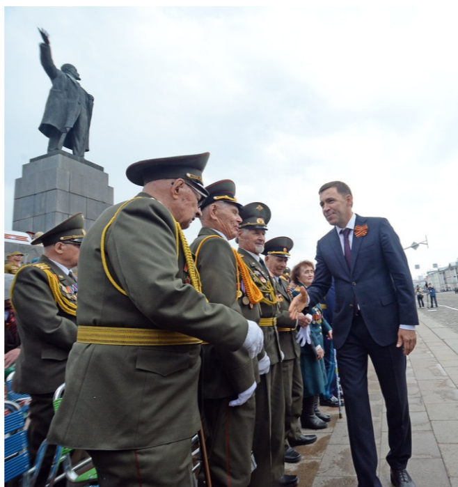
Президент России объявил 2020 год Годом памяти и славы. И это налагает на всех нас особую ответственность: мы должны встретить юбилей Великой Победы достойно славы народа-победителя.

Федеральное руководство поддерживает наши планы по преобразованию столицы Урала. Президент России Владимир Владимирович Путин на пресс-конференции 19 декабря дал высокую оценку темпам развития Екатеринбурга и оценил перспективы строительства второй ветки метро. Лидер страны сказал: «Екатеринбург очень бурно развивается, становится всё более и более современным, и, конечно, он нуждается в развитии инфраструктуры. Некоторое время назад было принято решение о том, что такие проекты должны осуществляться на основе региональных возможностей и ресурсов. Но это невозможно. Поэтому реализация подобных проектов, конечно, должна осуществляться совместно с федеральными властями, при федеральной поддержке. Не сомневаюсь, что такой вид транспорта будет очень актуальным и востребованным в Екатеринбурге. Надо просто с властями как следует на этот счёт поработать, с региональными властями. Поработа-