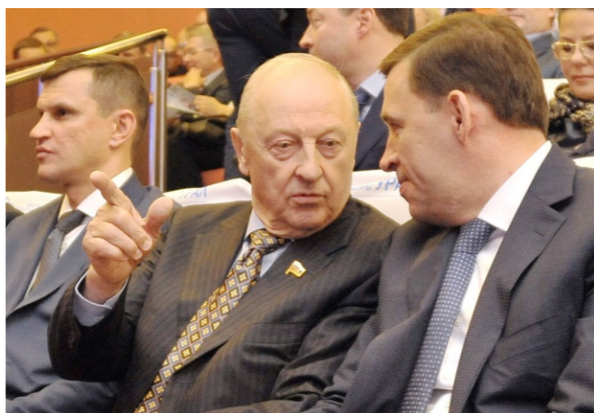
Эдуард Эргартович Россель мечтал о времени, когда бюджет Свердловской области перевалит планку в 200 миллиардов рублей. Вот тогда, говорил он, начнётся не выживание, а развитие. Сейчас мы вплотную подошли к областному бюджету в 300 миллиардов рублей. Моя цель – преодолеть и этот рубеж.

Лет десять назад Эдуард Эргартович Россель мечтал о времени, когда бюджет Свердловской области перевалит планку в 200 миллиардов рублей. Вот тогда, говорил он, начнётся не выживание, а развитие. Мы давно преодолели этот рубеж и видим, насколько справедливо было это замечание – стройки, ремонты, преобразования идут в каждом муниципалитете Урала, на деле демонстрируя превращение мечты в