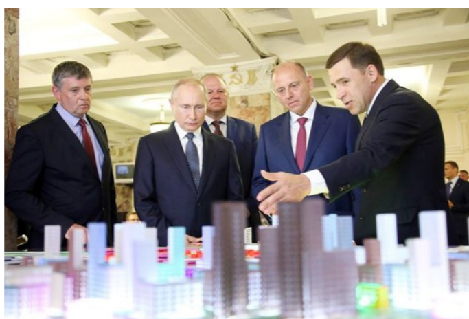
Евгений Куйвашев в присутствии полпреда Президента РФ в УрФО Николая Цуканова и бизнесмена Дмитрия Пумпянского показывает Владимиру Путину проект спортивного кластера в Екатеринбурге.

Работая на посту губернатора Свердловской области уже восьмой год, зная реальную картину жизни в регионе, твёрдо, с уверенностью могу сказать: у нас нет повода для беспокойства, мы заложили прочный фундамент для благополучия региона, мы знаем, что нужно делать, и настроены на работу. Значит, мы преодолеем трудности, и у нас будет хороший год, хорошая работа, достаток, благополучие, уверенность в себе, в своих силах, в завтрашнем дне.