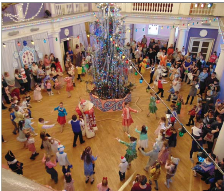
Бусы повесили, встали в хоровод.