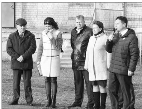
Открытие спортивной площадки в Мартюше