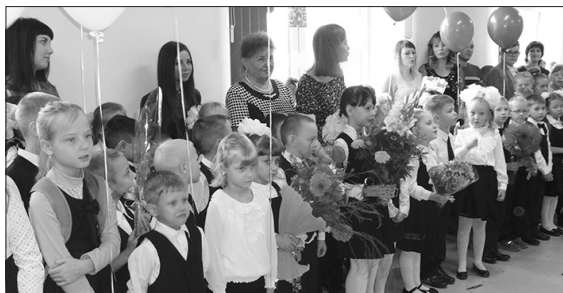
День знаний в новой школе в Покровском

* В День знаний в Покровском прошло торжественное открытие отремонтированной школы для учеников начальных классов, 80 учащихся сели в этот день за парты в новой школе.