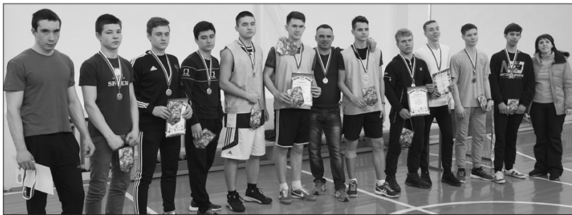
Участники районного конкурса «А ну-ка, парни!»

* Первое место в районном военно-спортивном празднике «А ну-ка, парни!» завоевала команда Новоисетского, второе – ребята из Мартюша, третье место заняла команда из Колчедана.