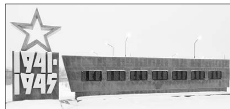
Парк Победы в Колчедане

* Завершено строительство парка Победы в Колчедане. Это комплексный объект, кроме восстановления обелиска воинам-односельчанам, павшим в Великой Отечественной войне, построены разные объекты, в том числе обелиск воинам-интернационалистам, зоны активного отдыха и детских игр. Открытие его будет приурочено к 75-летию Победы.