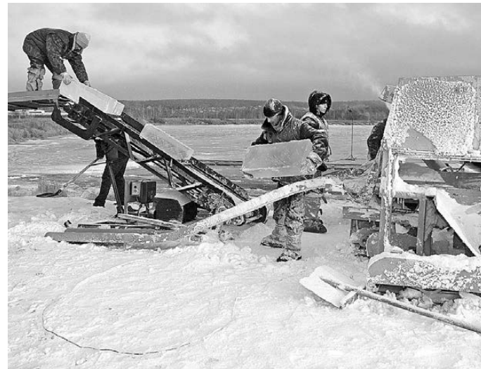
Заготовить лед, пригодный для создания скульптурных композиций, непросто. Нынешний материал в Тюмени не подкачал.

кий» сезон по городам Ямала и Тюменской области, материал видел всякий.