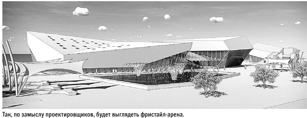
Так, по замыслу проектировщиков, будет выглядеть фристайл-арена.

На комбинате подчеркивают, что инициатором проекта