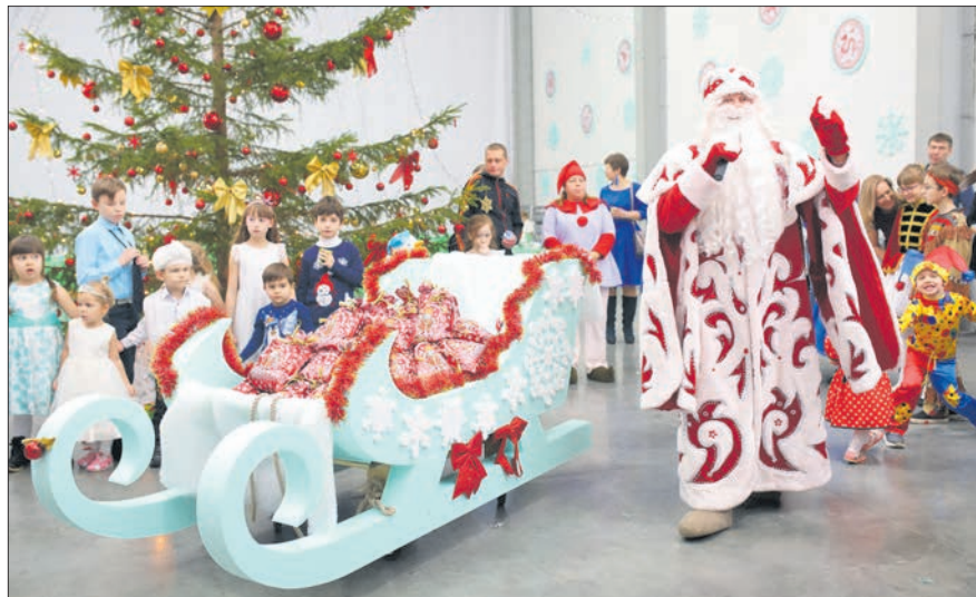
Новогоднее представление для гостей ЗЭМ «Экстрол».