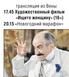
трансляция из Вены 17.45 Художественный фильм «Ищите женщину» (16+) 20.15 «Новогодний марафон» 22.15 Художественный фильм «Замороженный» (12+) 23.35 Вечер современной хореографии в театре Ковент-Гарден 01.25 «Песня не прощается... 1975 год» 02.20 Мультфильмы «Падал прошлогодний снег». «32 декабря»