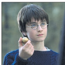
СТС • 20.00 «Гарри Поттер и философский камень» (12+)