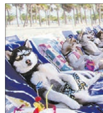
СТС • 23.35 «Снежные псы» (12+)