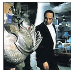
Культура • 18.35 «Гараж» (16+)

ПЕРВЫЙ 05.00 Х/ф «Старик Хоттабыч» (0+) 06.00 Новости. (12+) 06.10 Х/ф «Старик Хоттабыч» (0+) 06.35 Х/ф «Марья-искусница» (6+) 08.00 Доброе утро. (16+) 10.00 Новости (16+) 10.10 Жизнь других. (12+) 11.10 Видели видео? (12+) 12.00 Новости (16+) 12.10 Видели видео? (12+) 13.20 Т/с «Практика» (16+) 15.10 Повтори! (16+) 17.15 Лыжные гонки. Кубок мира 2019 г. - 2020 г. Тур де ски. Спринт. (12+) 18.00 Угадай мелодию. (12+) 18.30 «Кто хочет стать миллионером?» 19.50 Пусть говорят. (16+) 21.00 Время. (12+) 21.20 Т/с Зелёный фургон (16+) 23.20 Вечерний Ургант. (16+) 00.15 Старые песни о главном (16+)