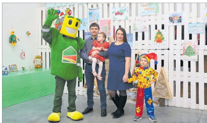
Гости новогоднего утренника.