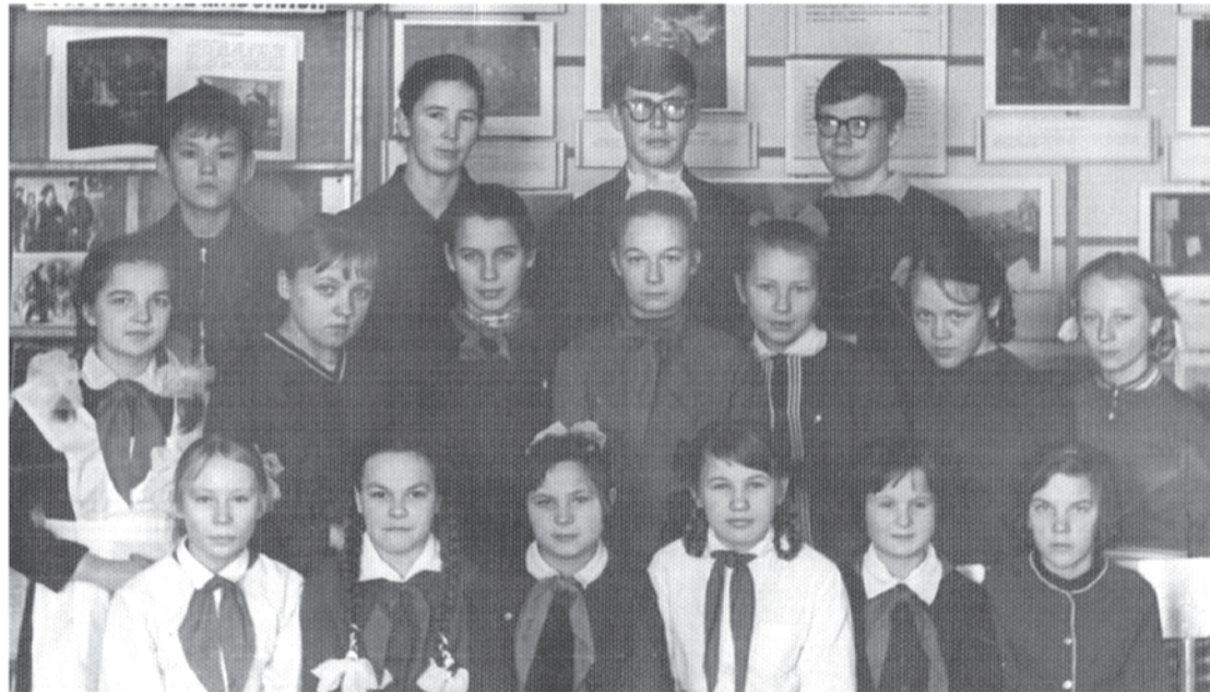
1967 год. Лучшие книгоноши в Троицкой библиотеке.