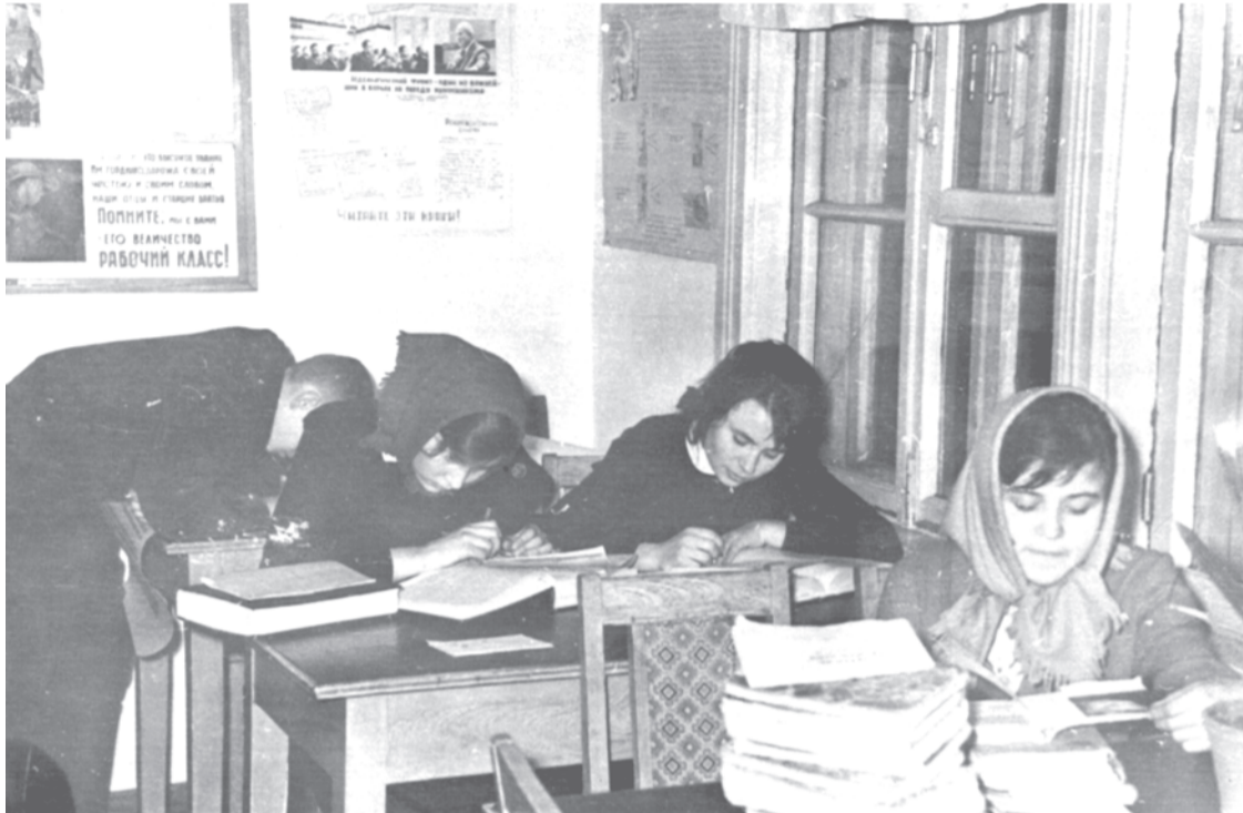
1964 г. Активисты в читальном зале Троицкой библиотеки.

Каждая фотография должна сопровождаться информацией о том, когда и где она сделана, что на ней изображено (или кто изображен), от кого получена.