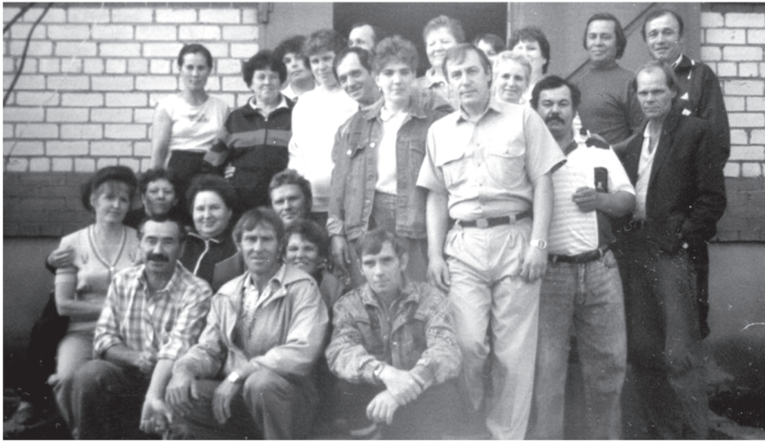
90-е годы прошлого века. Бригада на строительстве домов молзавода.

Каждая фотография должна сопровождаться информацией о том, когда и где она сделана, что на ней изображено (или кто изображен), от кого получена.