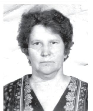
Родные и близкие.