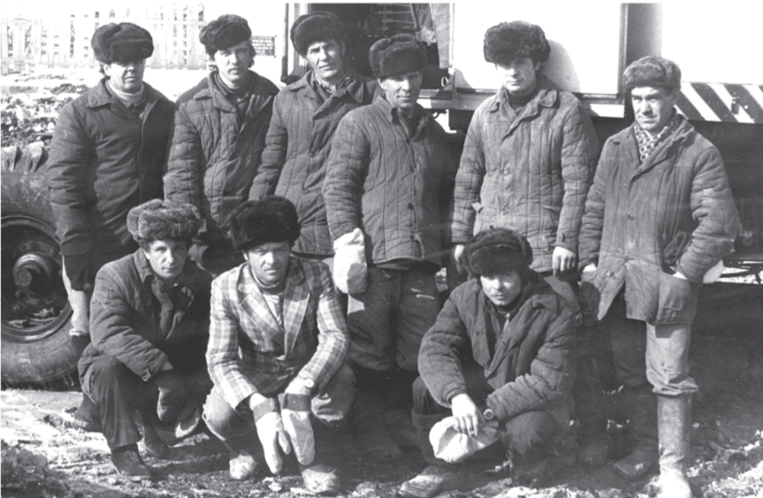
1987 год. Бригада плотников ПМК-5 на строительстве школы в Пановой.