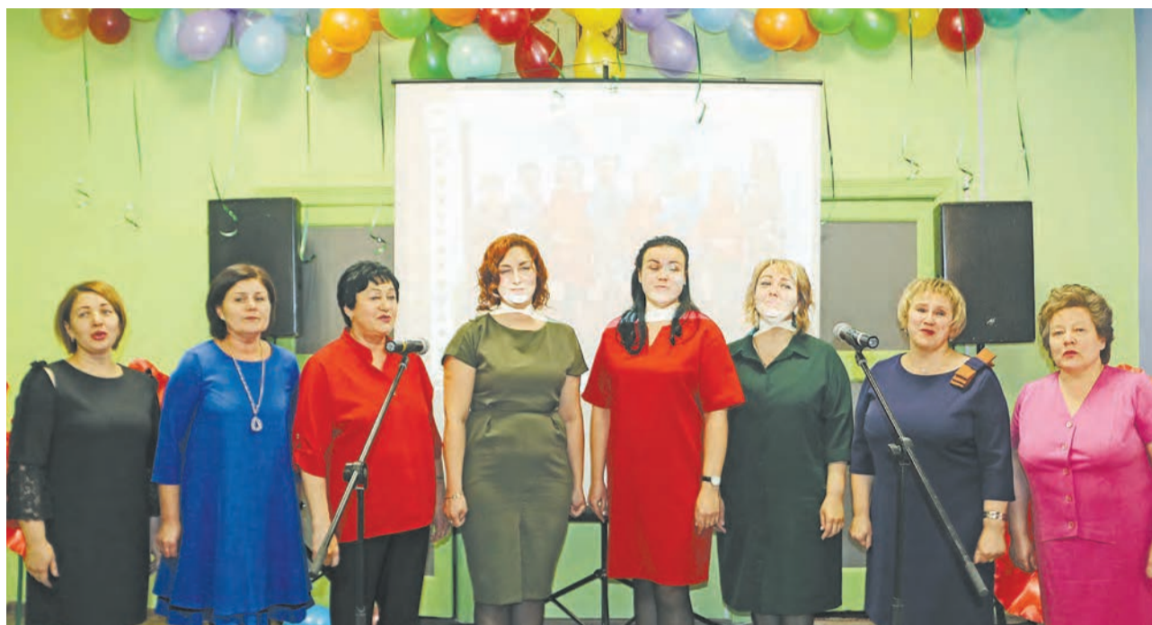
Коллектив поёт: «Всё, что в жизни есть у меня, это библиотека моя...»