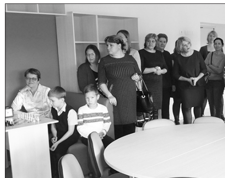
На открытии «Точки роста» в Каменской школе