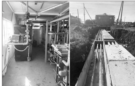
Газовая котельная в Травянском готовится к запуску

Частично сказывается близость города: тот, кто хочет работать, трудоустраивается там. Людей, торгующих на базаре, калачом в магазин не заманишь: там же нужно отчитываться за каждый рубль, выходной по собственному желанию не устроишь. Стабильно стоящие на учете в службе занятости довольствуются пособиями, им заставить себя работать все труднее.