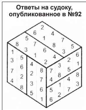
Ответы на sudoku, опубликованное в №92

06.00, 23.00, 05.20 Итоги недели 06.50, 05.05 «Обзорная экскурсия» (6+) 07.05 «МузЕвропа» (12+) 08.00 X/ф «Любимая женщина механика Гаврилова» (12+) 09.20, 16.15 «Большой поход Гумбольдта» (12+) 09.45 X/ф «Пальмы в снегу» (16+) 12.40 X/ф «Психопатка» (16+) 14.40 X/ф «В стреляющей глуши» (12+) 16.35 X/ф «Мужчина в доме» (16+) 18.00 Телепроект «Жена. История любви. Ольга Орлова» (12+) 19.15 X/ф «Максимальный удар» (16+) 21.15 X/ф «О любви» (16+) 23.50 «Чет-вертая власть» (16+) 00.20 X/ф «Атлантида» (18+) 01.55 X/ф «Дикий» (18+) 03.35 Фестиваль «Жара» (12+) 05.45 «Прокуратура. На страже закона» (16+)