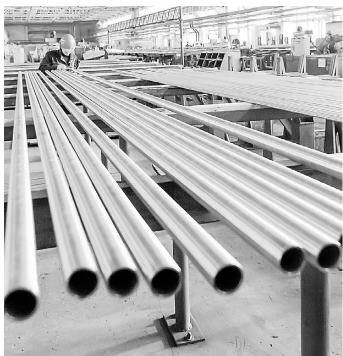
Каменское предприятие производит трубы самых разных размеров и назначения, ежегодно расширяя номенклатуру продукции.

— Использование химикатов для дорожников очень эффективно, ведь вывоз снега влечет большие затраты. Слой снега глубиной более 7–10 сантиметров убирает специальная техника, а если меньше, справляются реагенты: это значительная экономия топлива, зарплата водителя снегоуборочных машин и т.д. Такие технологии применяются давно, во многом они взяты с Запада, но там, в отличие от нашей страны, техника сразу убирает всю эту кашу. В Екатеринбурге технология уборки очень старая, новые только в столице — там снег никогда не вывозят, снегоплавильные агрегаты выливают жидкость в ливневую. У нас же на большинстве городских магистралей система ливневой канализации просто не работает, не справляется с нагрузкой, ее нужно реконструировать. Кроме того, наш климат отличается от европейского, поэтому просто полагаться на их новшества не получается, а у нас, к сожалению, никаких исследований не ведется. Нужно создавать лаборатории, изобретать новую уборочную технику, современные реагенты. Вообще в сфере ЖКХ требуется технологический скачок.