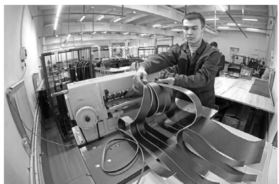
Кожаные ремни местного производства наверняка будут пользоваться спросом у уральцев.

В Арамии заработало новое предприятие по производству изделий из кожи: сумок, кошелек, ремней, снаряжения для охотников и других товаров. «Урал кожа» имеет собственную сырьевую базу — Камышевский кожевенный завод. Ведутся работы по организации выпуска фурнитур для кожаналгерей, через полтора-два года планируется открыть производство обуви — 10–15 тысяч пар в месяц. В течение года на площадке будет создано 80 рабочих мест, впоследствии еще около двухсот. Отметим, для приобретения оборудования предприятие воспользовалось мерами господдержки.