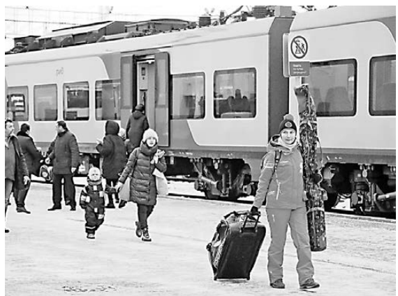
Жители соседних регионов теперь могут добраться до Екатеринбурга всего за пять часов.

На этой неделе в Тюмень и Пермь «прилетели» первые «Ласточки» из Екатеринбурга. Теперь скоростные электрички ежедневно курсируют между региональными центрами. От Тюмени до столицы Урала комфортабельная электричка следует с семью остановками ровно пять часов. Может двигаться и быстрее, но для этого необходимо модернизировать несколько участков пути (что в планах РЖД). Сегодня «Ласточка» совершает один рейс в сутки, в следующем году, как ожидается, будет делать уже два. И не исключено, что скоро пятивагонные составы начнут ходить из Тюмени в Ишим и Омск. Запуск новых маршрутов «Ласточек» — долгожданное событие для их производителей — СП концерна Siemens и Группы «Синара». Впервые о регулярном выходе поезда на магистраль Тюмень — Екатеринбург заговорили еще в 2016 году.