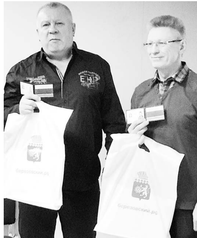
Новым членам ДНД вручили удостоверения

томобиль и уехали. Взрослый мужчина наблюдал картину и даже не подумал позвонить по 02. Вы видите объявление о продаже наркотиков и проходите мимо. На Западе такое «стукачество» вообще-то называют гражданской позицией. Порядок и безопасность не может быть головной болью только власти и полиции: все общество должно быть озабочено этим. Сейчас активно растет новый микрорайон Уют-Сити, сам Бог велел здесь создать ДНД. Но пока ее, как мы знаем, нет.