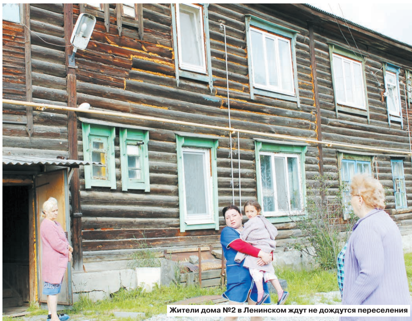
Жители дома №2 в Ленинском ждут не дождутся переселения