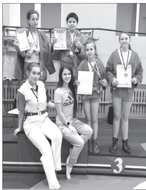
7 декабря в Верхней Салде прошел От-

крытый областной турнир по борьбе самбо среди юношей и девушек 11-12 лет, посвящённый Дню Героев Отечества. В турнире приняли участие более 120 спортсменов из городов Верхняя Салда, Нижний и Верхний Тагил, Качканар, Ирбит, Верх-Нейвинск, Кировград, Североуральск.