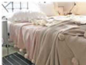
КРАСИВЫЙ ТЁПЛЫЙ ПЛЕД