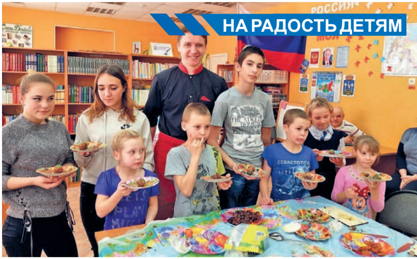
НА РАДОСТЬ ДЕТЯМ