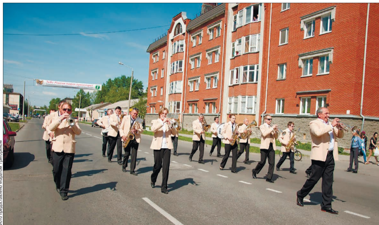
С носка на пятку — легко и играючи

— Да, и там, и там я и дирижер, и трубач. Сложно, а что делать? Здесь ведь уже детище, и бросить я не могу: прикипел, и коллектив стал родным. Знаете, у нас отношения