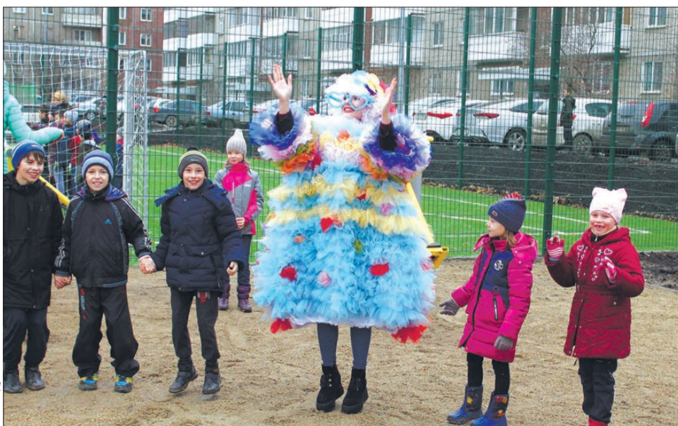
Хлопаем в ладоши и прыгаем вместе с Цветиком Семицветиком!

Двор на Трубников, 48-а – это один из тех объектов комплексного благоустройства, за которые проголосовали первоуральцы, отвечая на вопрос, какие общественные территории нужно развивать в рамках федеральной программы по формированию комфортной городской среды. Что важно, намеченные горожанами планы воплощаются в жизнь.