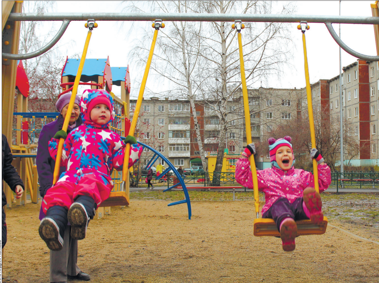
Качели – двойные, чтобы без лишней очереди и слез...

13 млн рублей – стоимость проекта, 5% от этой суммы заплатили сами жители 9200 кв. метров – общая реконструированная площадь двора 1600 кв. метров – общая площадь парковочных мест 28 опор наружного освещения установлены по периметру двора