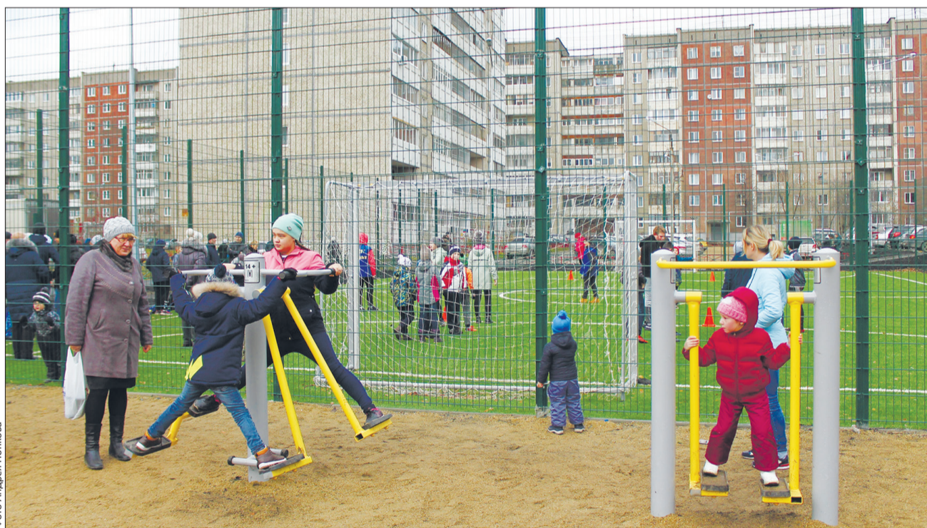
Вместительный «тренажерный зал» теперь – под окнами

которые здесь трудились, и, конечно, жителей, которые сделали все возможное, чтобы двор стал таким, как сейчас. Я хочу сказать большое спасибо всем вам за то, что вы были активными участниками этого непростого, но такого необходимого процесса: вместе разрабатывали проект, помогали в озеленении, с пониманием относились к временным неудобствам, которые возникали во время проведения строительных работ. Сейчас самая главная задача – сохранить эту красоту для вас и ваших детей.