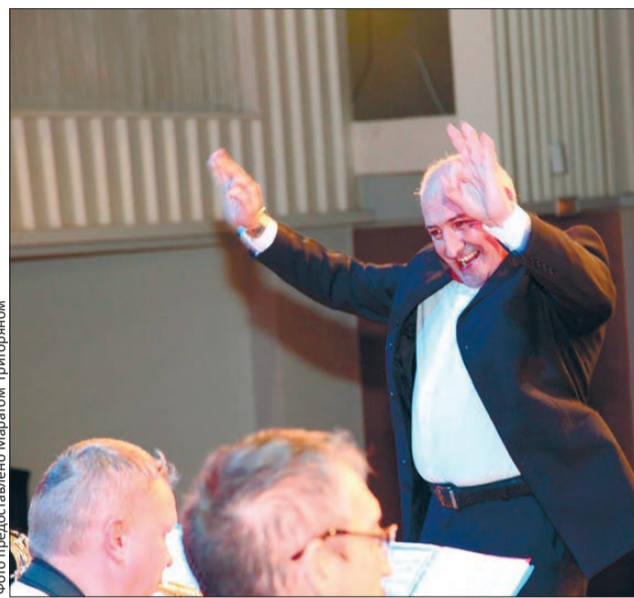
Оркестр начинается с дирижера