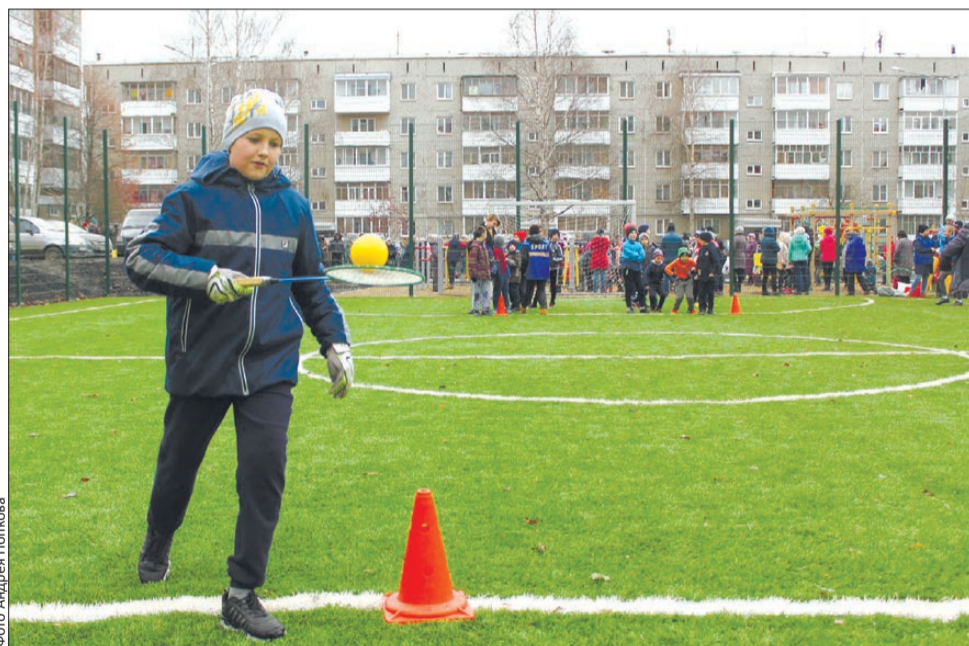
Искусственные поля есть не в каждом городе, у нас – даже во дворе

13 млн рублей – стоимость проекта, 5% от этой суммы заплатили сами жители 9200 кв. метров – общая реконструированная площадь двора 1600 кв. метров – общая площадь парковочных мест 28 опор наружного освещения установлены по периметру двора