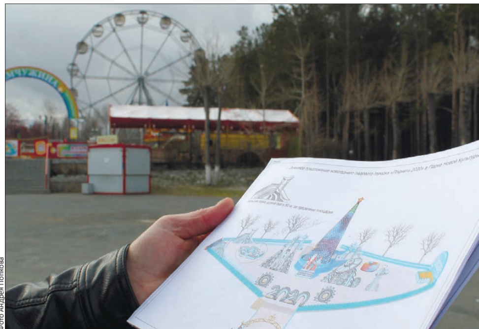
Совсем скоро здесь вырастет ледовый городок

В Первоуральске все еще стоят бесснежные деньки. Однако Новый год все ближе, и уже стало известно, каким же предстанет ледовый городок нового десятилетия в Парке новой культуры.