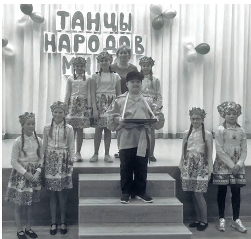
● Коллектив 5 «Б» класса, получивший Гран-при конкурса

В Бисертском городском округе 28 ноября в школе № 1 прошёл муниципальный фестиваль танцев народов мира - «Все страны в гости к нам».