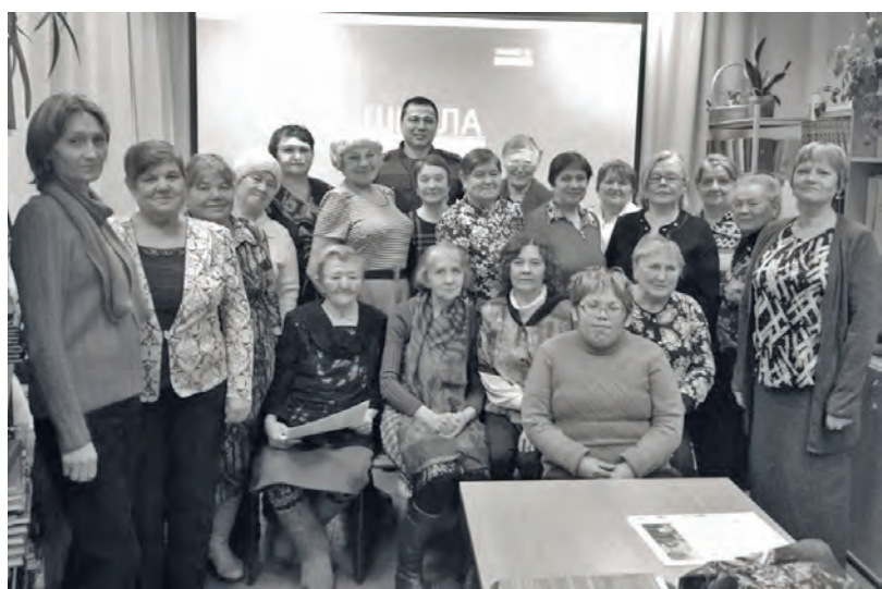
● Фото на память