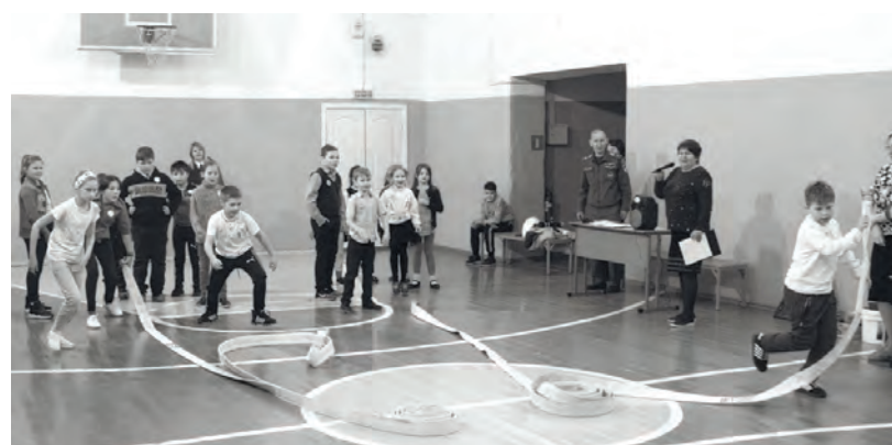
● Подготовка к тушению пожара

В соревнованиях юные спасатели-пожарные проявили все свои лучшие качества, навыки и умения. По итогам конкурса, конечно же, победила дружба. Детям были вручены вкусные подарки.