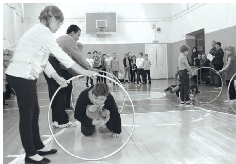
● Спасение «пострадавших»