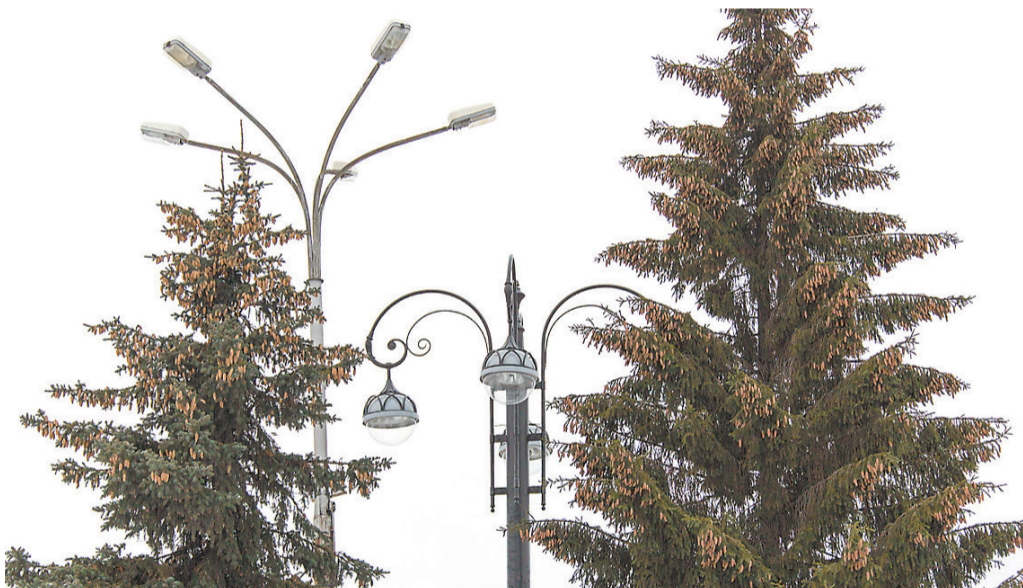
Старые и новые светильники на Театральной площади.

При замене линий наружного освещения по программе «Светлый город» на улицах Горошниковой, Пархоменко и проспекте Строителей повреждены часть деревьев и несколько десятков кустарников. Тревогу забили жители.