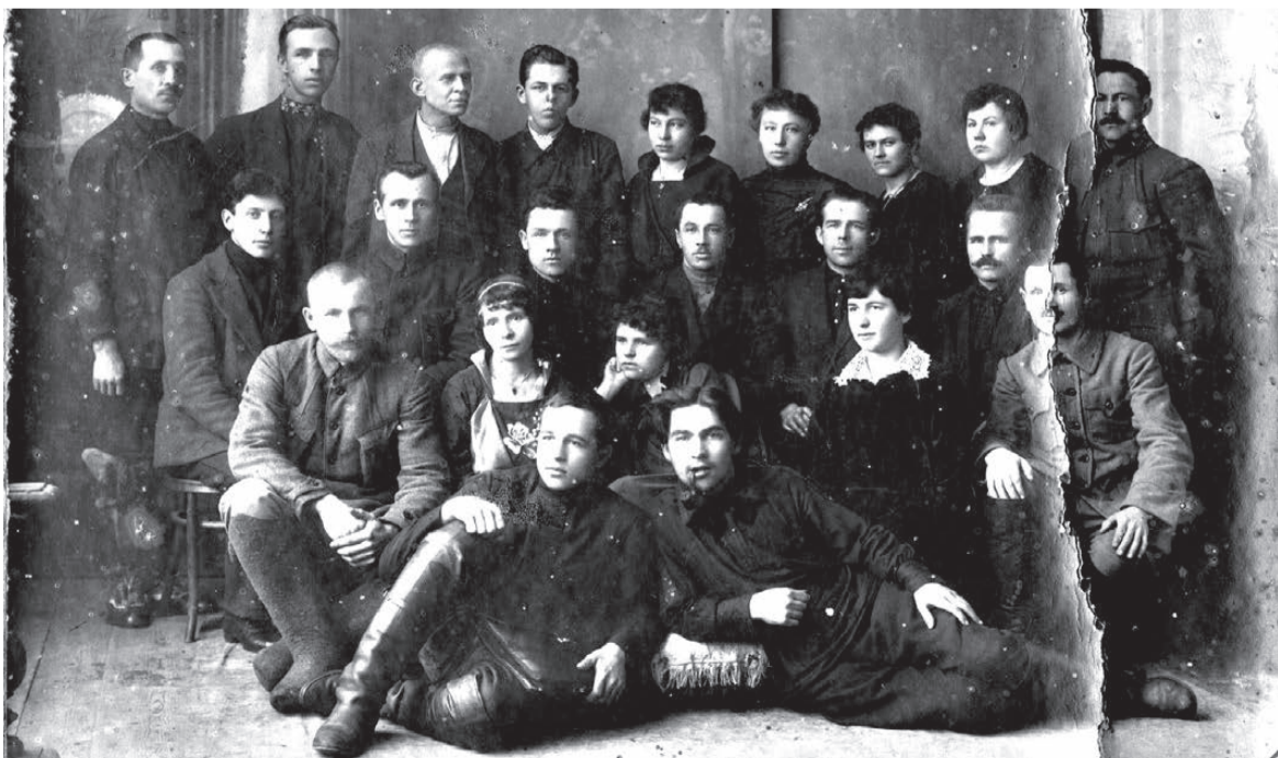
Надпись на снимке: «Н.-Тагил. Весна - 1923 г. Штат Ср. Ур. райкома».

Ведущая рубрики Людмила ПОГОДИНА.