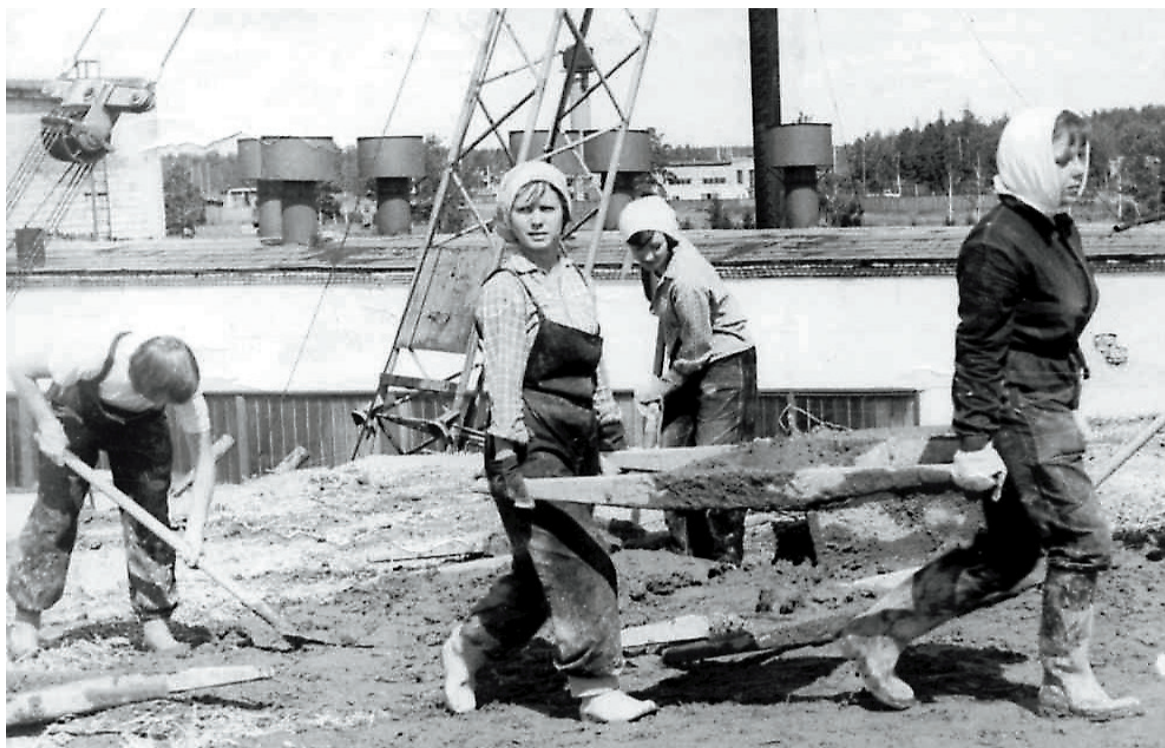
Стройотряд «Улыбка», 1979 год.