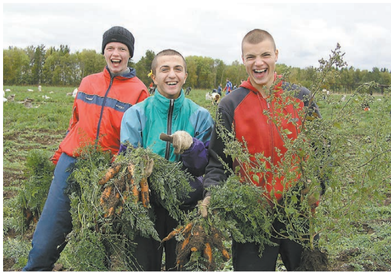
Уборка моркови в пригородном совхозе, 2005 год.

Учебно-лабораторный корпус в то время, когда я учился, находился на улице Уральской, 4, в здании демидовских времен. Там стояли станки, лабораторное оборудование. Так как дом старый, потребовалось провести экспертизу перекрытий. А для этого надо было снять утеплитель, оторвать доски. Нас, студентов, привлекли на субботник. Работая на чердаке, в углу мы обнаружили кучу бумаг. Нас это заинтересовало. Один из документов был написан на толстой пожелтевшей бумаге каллиграфическим почерком с «ятями», «фитой»... Содержание не помню, но кто-то кому-то о чем-то докладывал. находку мы отнесли в музей.