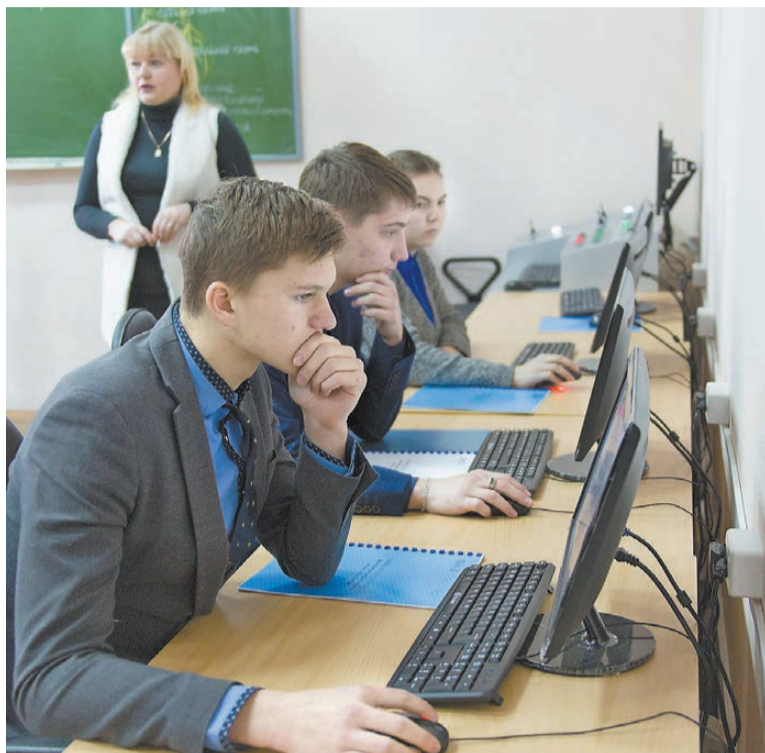
В новой лаборатории идет занятие.

Но лаборатории, оборудование для которых НТГМК приобрел при благотворительной поддержке ЕВРАЗ, по своей сути, уникальные. Комплексы «Обработка металлов давлением» и «Технология производства стали и оборудование металлургических цехов» оснащены современными компьютерами, аппаратно-программными тренажерами, информационными стендами. Компания инвестировала в покупку обучающих комплексов 3,5 млн. рублей.