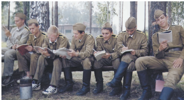
На военных сборах, 1998 год.

В том же леспромхозе работал мужской отряд из пединститута с худграфа «Палитра». Вот ведь как бывает: женский – из политеха, а мужской – из педагогического. Было весело! А теперь по секрету раскрою многолетнюю тайну: та вывеска «Улыбка» была над парикмахерской (что тут скажешь: у феминизма женское лицо). Но с названием попали «в яблочко» – все хорошее в жизни начинается с улыбки. Приятно, что стройотряд до сих пор существует.