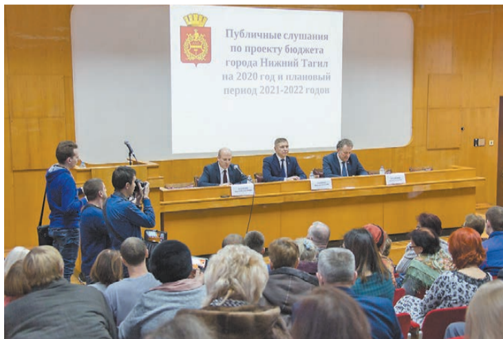
Каким быть бюджету-2020, обсуждали с горожанами.

Основные направления: развитие и поддержка городского транспорта, ремонт и эксплуатационное содержание дорог, содержание объектов внешнего благоустройства, создание ком-