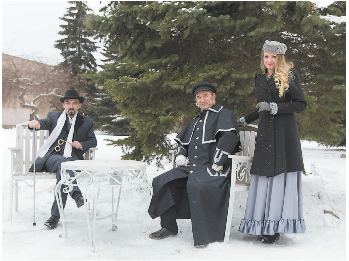
Чеховские герои в Артистическом сквере.

“ Уличная композиция была навеяна знаменитой фотографией «Чехов в Ялте». А чем наш город хуже Крыма для такой инсталляции? ”