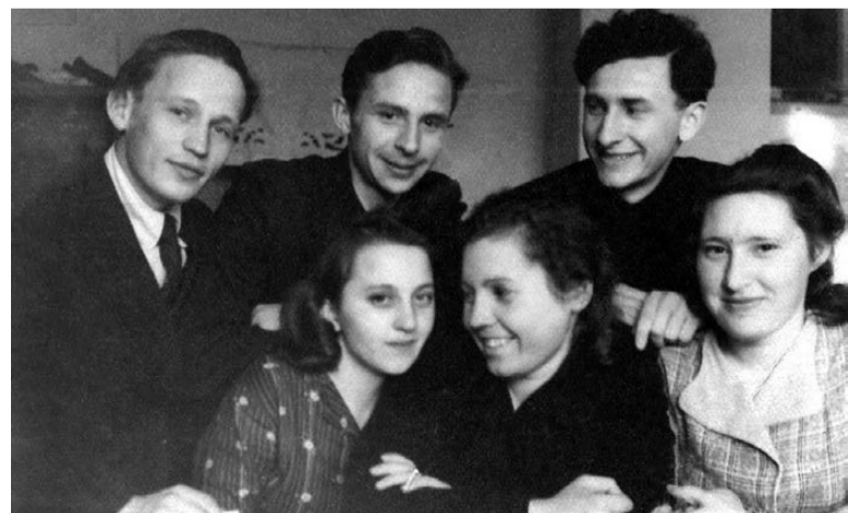
Студенты НИИИ, 1944 год.