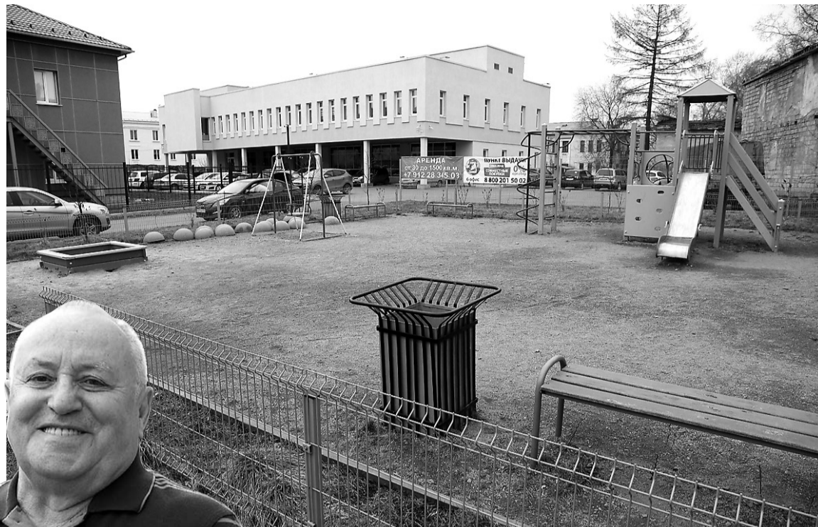
Территория, о которой идет речь, примыкает к дальней границе площадки (снимки сделаны в мае 2019 года).

Уверен, если будет в квартале спортплощадка, у подростков появится альтернатива уличной гульбе и хулиганству. А часть ребят основательно займется физкультурой, ведь для этого не нужно будет каждый раз отправляться на набереж-