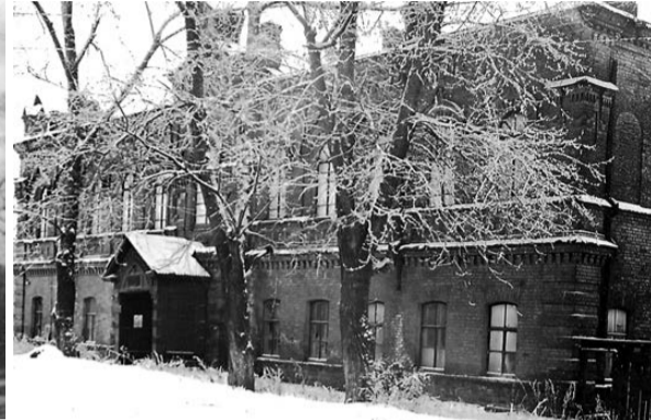
Второе здание института на Уральской.

1970 года приказом министра высшего и среднего образования РСФСР вечерний факультет Уральского политехнического института в Нижнем Тагиле реорганизован в филиал УПИ. На дневное отделение принято 25 студентов по новой для вуза специальности «Производство корпусов».