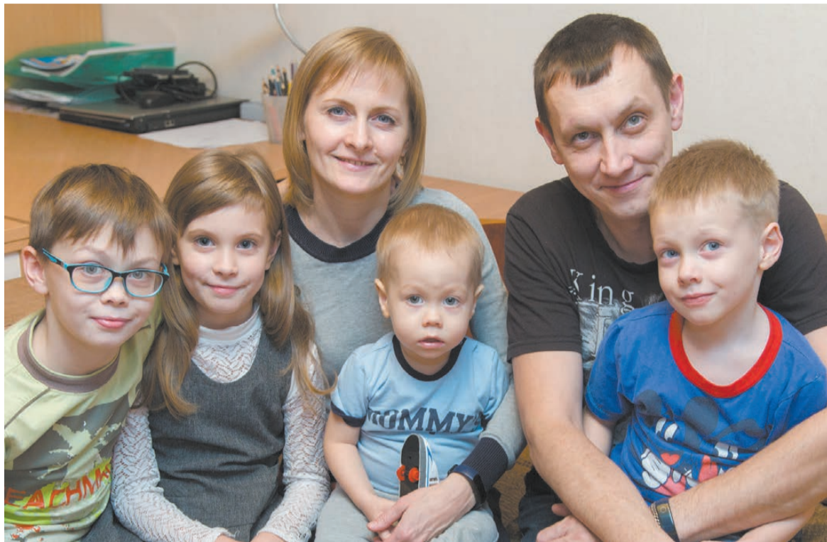
Редкий кадр: все дома!