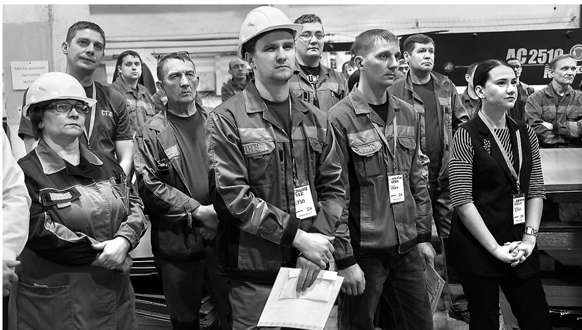
Церемония проходила прямо в цехе.