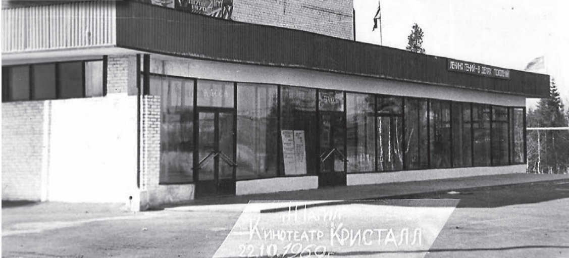
Кинотеатр «Кристалл», на снимке указана дата – 22 октября 1969 года.

А мы по-прежнему предлагаем нашим читателям вместе составлять фотолетопись родного города и присылать свои снимки. Не забудьте сделать пометку – «Фотолетопись». Лучшие работы будут опубликованы на страницах газеты «Тагильский рабочий».