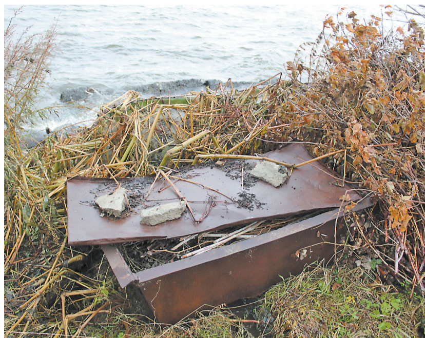
Компост на берегу.

рактрную постройку на берегу. - 14 лет туда ходим.