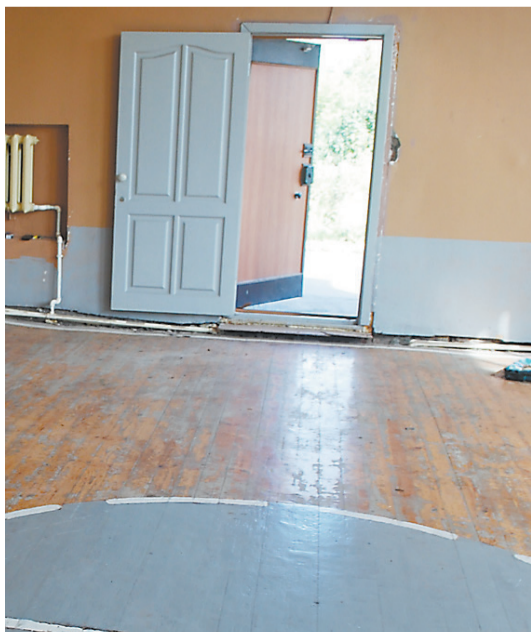
Так выглядел спортзал до ремонта.

Людмила ПОГОДИНА. ФОТО АВТОРА И ИЗ АРХИВА ШКОЛЫ.