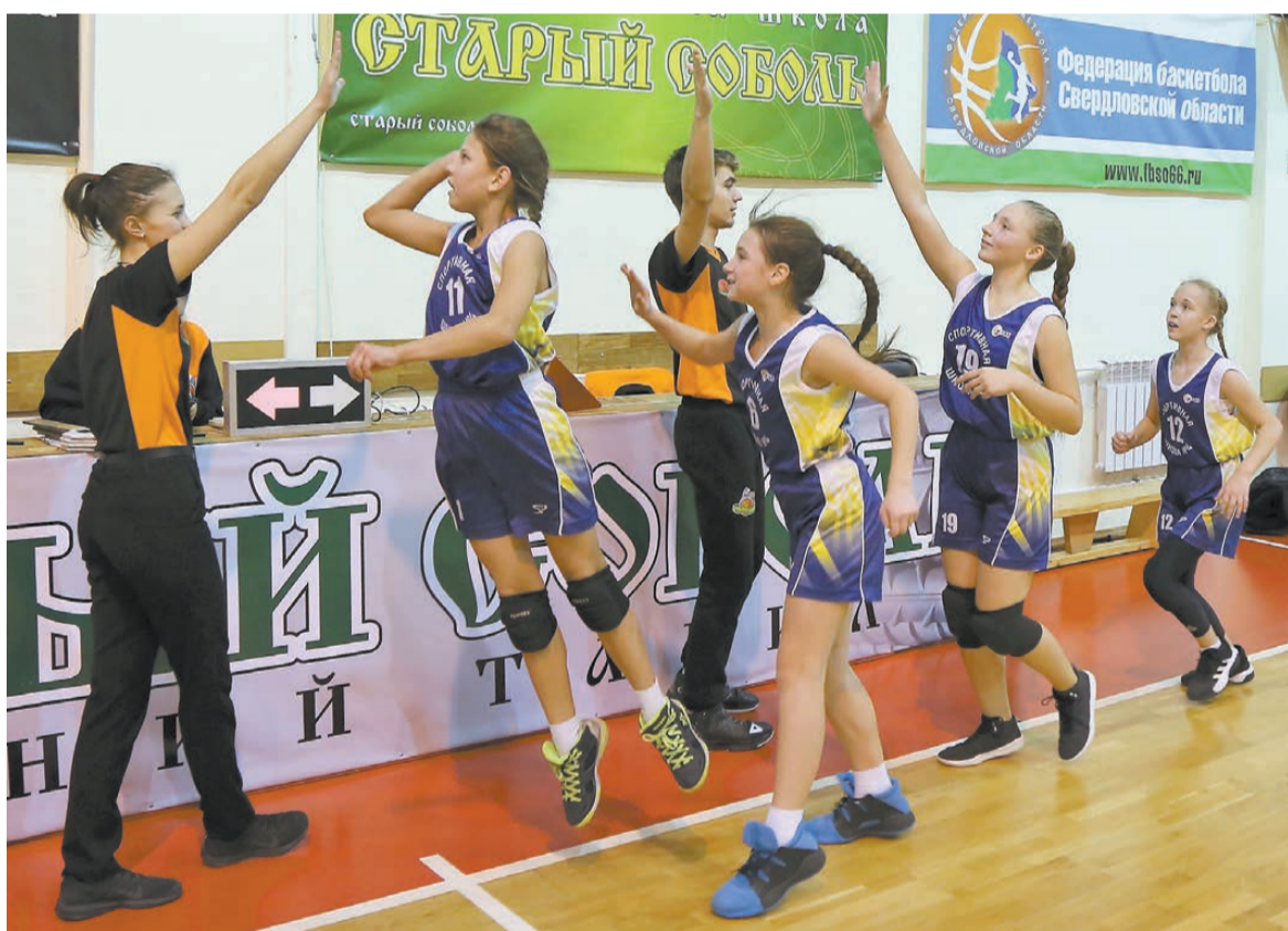
Уральская лига. Баскетболистки СШ №4 приветствуют арбитров по окончании матча.