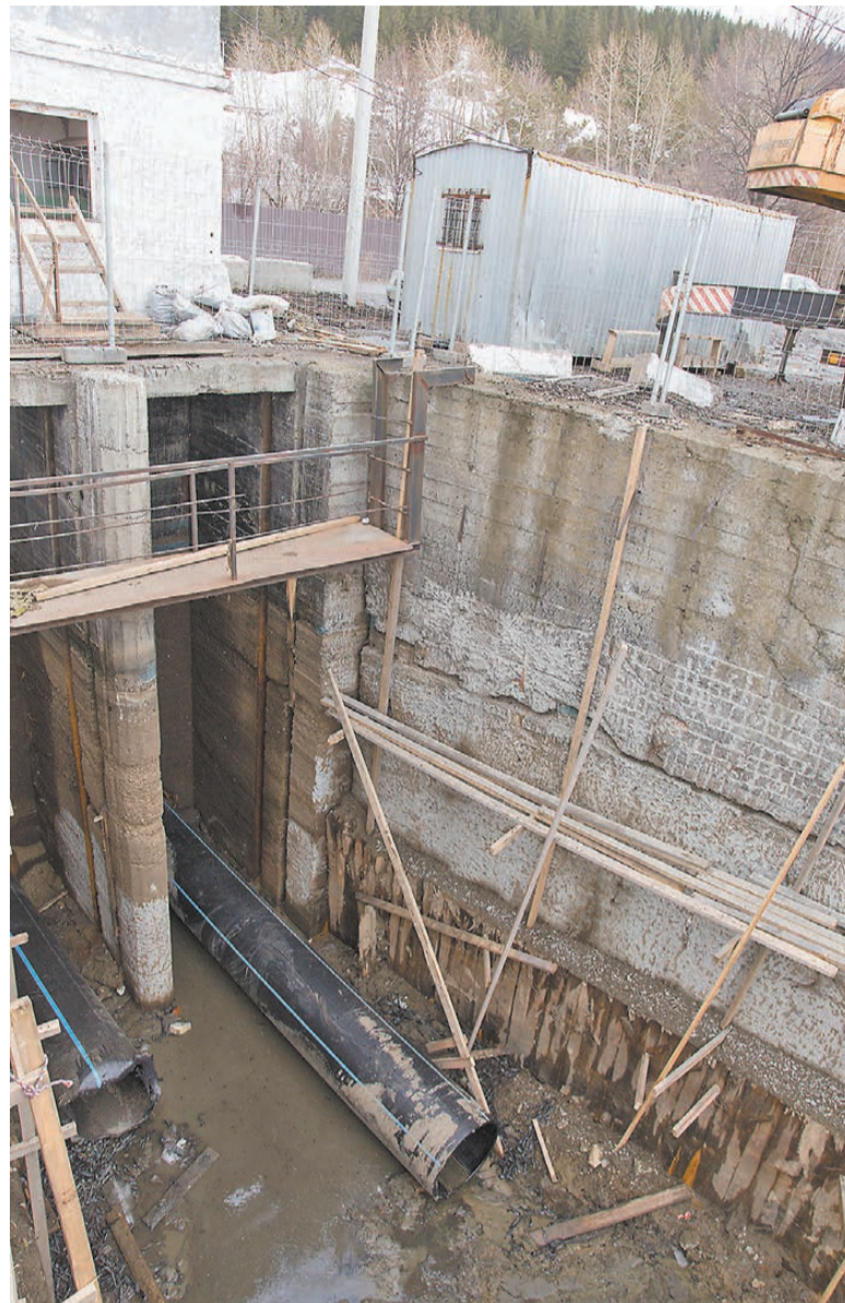
Плотина в разгар ремонта.