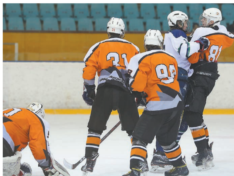
ЮХЛ. Борьба в матчах «Спутник 2002» - «Югра-ЮКИОР 2002» (Ханты-Мансийск) была острой.

В субботу, в ФОК «Президентский», в очередном туре первенства Нижнетагильской