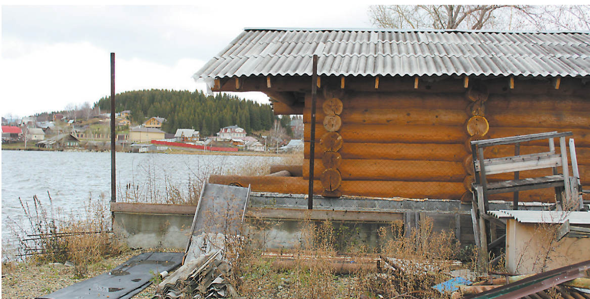
Немаленькая баня на берегу.