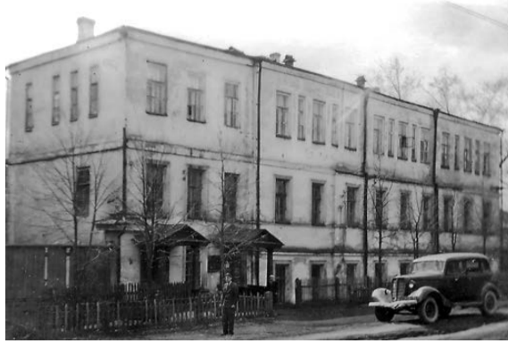
Старое здание института на улице Уральской.

1970-1980-е годы. Высокими темпами развивается промышленность Нижнего Тагила. Ей требуются новые технологии, новые решения. В октябре