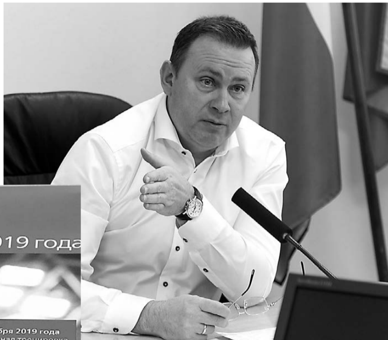
Глава города Владислав Пинаев.

На 7-8 декабря ЕВРАЗ НТМК выделит автобусы, которые привезут зрителей с Тагилстроя, Гальянки и Вагонки. Вопросы о размещении точек питания