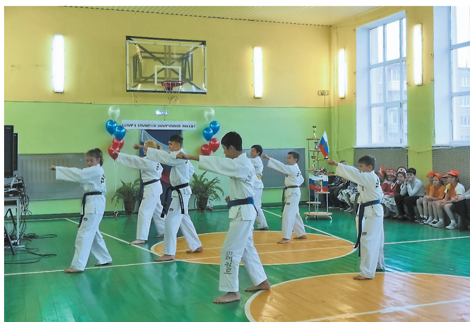
Показательные выступления школьников в обновленном зале.