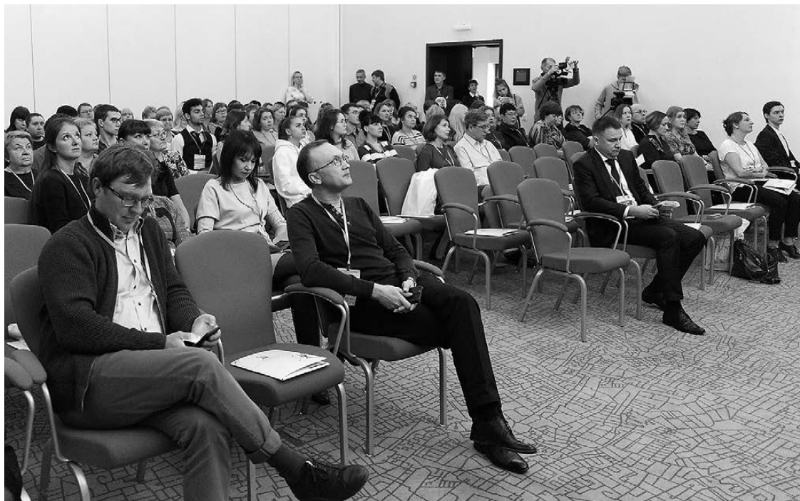
Перед началом конференции.

Когда лаборатория была только открыта, в ней проводилось около 1200 исследований в год. Сейчас - больше 2,5 миллиона. 87 сотрудников работают по различным направлениям. Обновление оборудования