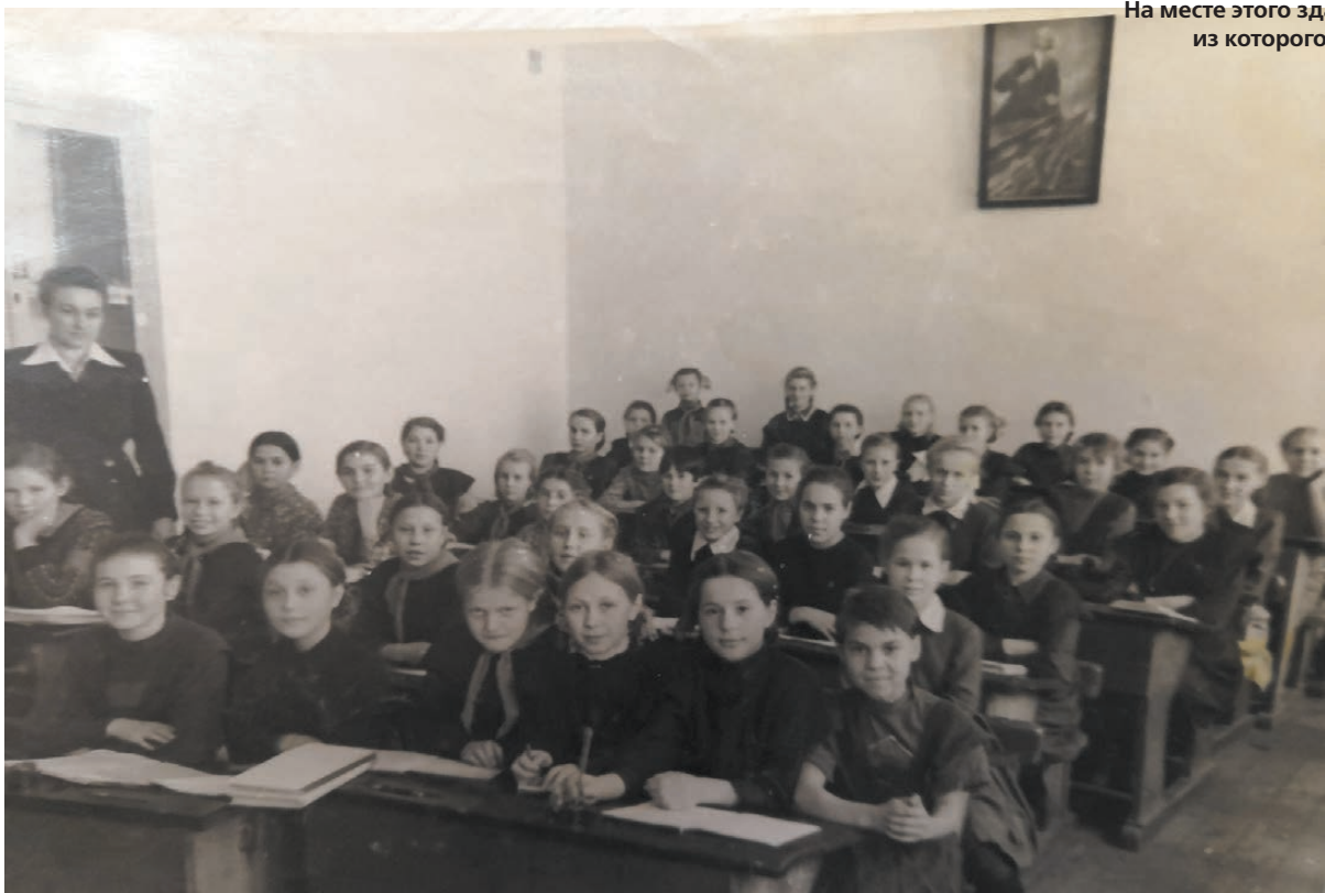
Школа №32, пятый класс.

«крейсеров» стали строить многоэтажные дома, появился жилой район, а с ним и дети. Старая школа уже не вмещала учащихся и была построена новая, №42, где я продолжала учиться.