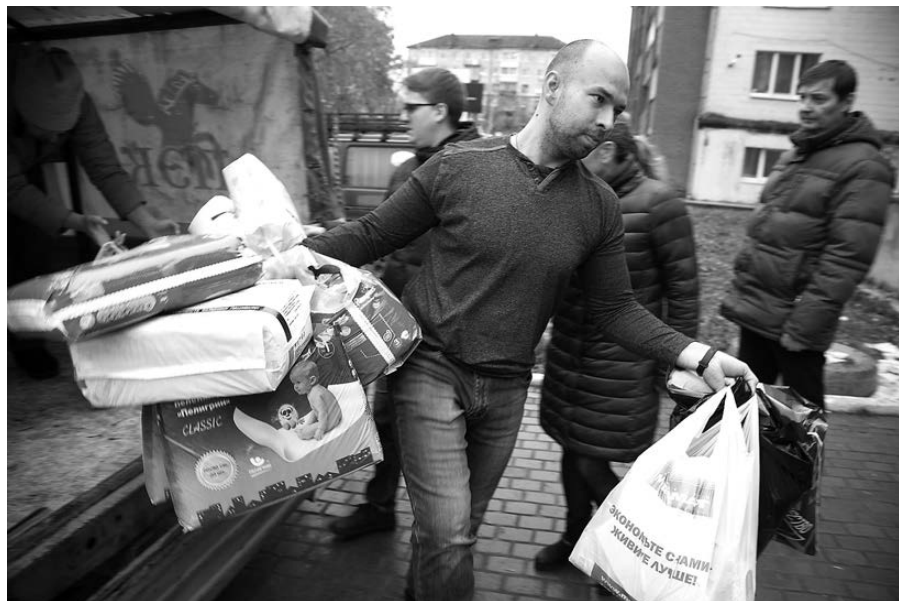
С подарками от тагильчан.

35 организаций и профильных управлений администрации города приняли участие в благотворительной