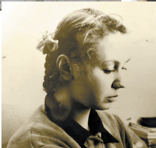
Школа №6, десятиклассница.

Вот фотография – выпуск первого класса школы №33, 1946-1947 годы. В то время наша семья жила на Вые, в доме на улице Фрунзе. Дом стоял на том месте, где сейчас находится трехэтажка с башенкой. Рядом был переулочек, он вел прямо к школе. В школе №33 в годы войны находился военный госпиталь, потом снова школа. Жизнь продолжалась, возвращались мужчины с войны. 1947 год – это время, когда вернулся с фронта мой отец, которого призвали еще в 1940-м, потом началась Великая Отечественная война, и я семь лет не видела своего папу. Город начал строиться, сносили