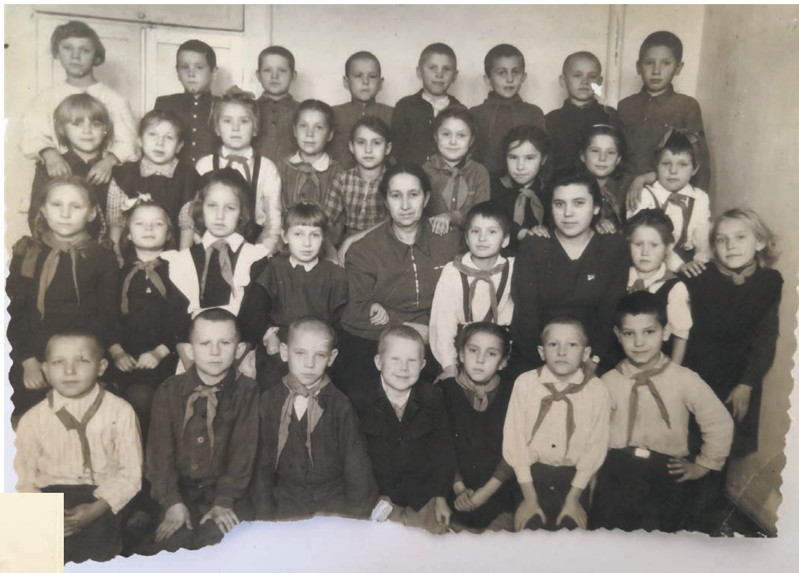
Класс находился в школе, расположенной на первом этаже жилого дома на Красном Камне. 1950 год.

Нашей семье выделили комнату в трехкомнатной квартире на соседней в доме на Красном Камне. Два новых пятиэтажных дома, как два огромных крейсера, плыли по необжитой земле. Школа была в одном из домов на первом этаже, а мы жили на четвертом. Жильцы стали осваивать землю вокруг домов, сажали, в основном, картошку, иногда морковь, лук, капусту. Вокруг наших