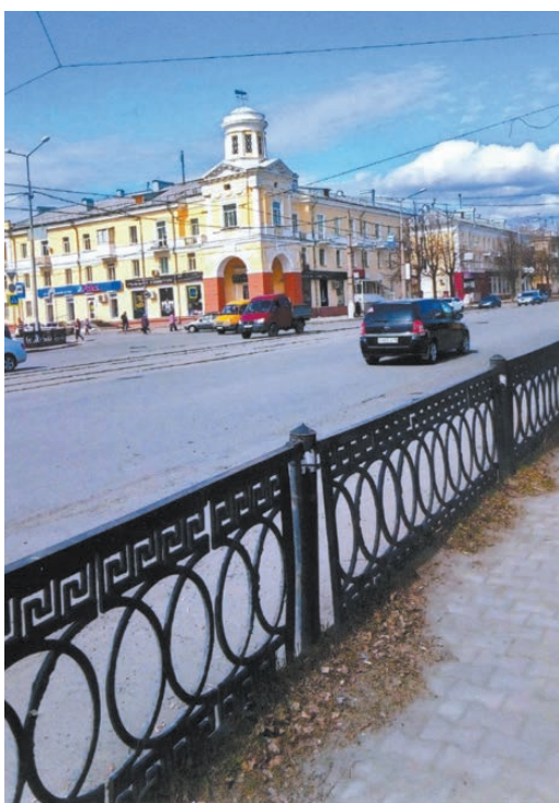
На месте этого здания стоял наш дом, из которого я шла в школу №33.