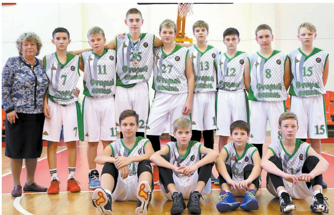
«Старый соболев» – 2006 – бронзовый призер первенства УрФО.

Смагин. На втором месте – баскетболисты Кургана.