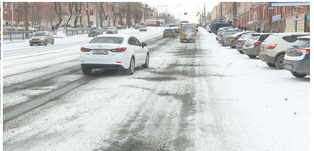
Вчера на проспекте Мира.

В прошлую пятницу, 8 ноября, погода вновь устроила экзамен для коммунальщиков. Из-за резкого похолодания дороги и тротуары покрылись коркой льда. В тот день в группе «ТР» в «Одноклассниках» мы провели опрос: интере-