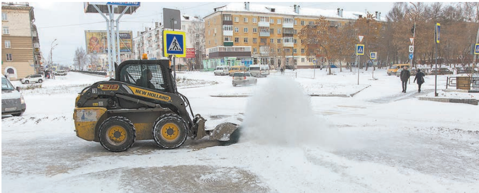
Вчера на проспекте Строителей.

Жалобы принимаются «Тагилдорстроем» в группе ВКонтакте