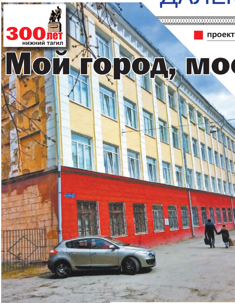
Школа №32 сегодня.

Передо мной лежат фотографии прошедшего XX века, в котором я прожила 62 года, а сейчас познаю век XXI. Фотографии XX века – это мое детство и юность, Нижний Тагил в послевоенные годы.