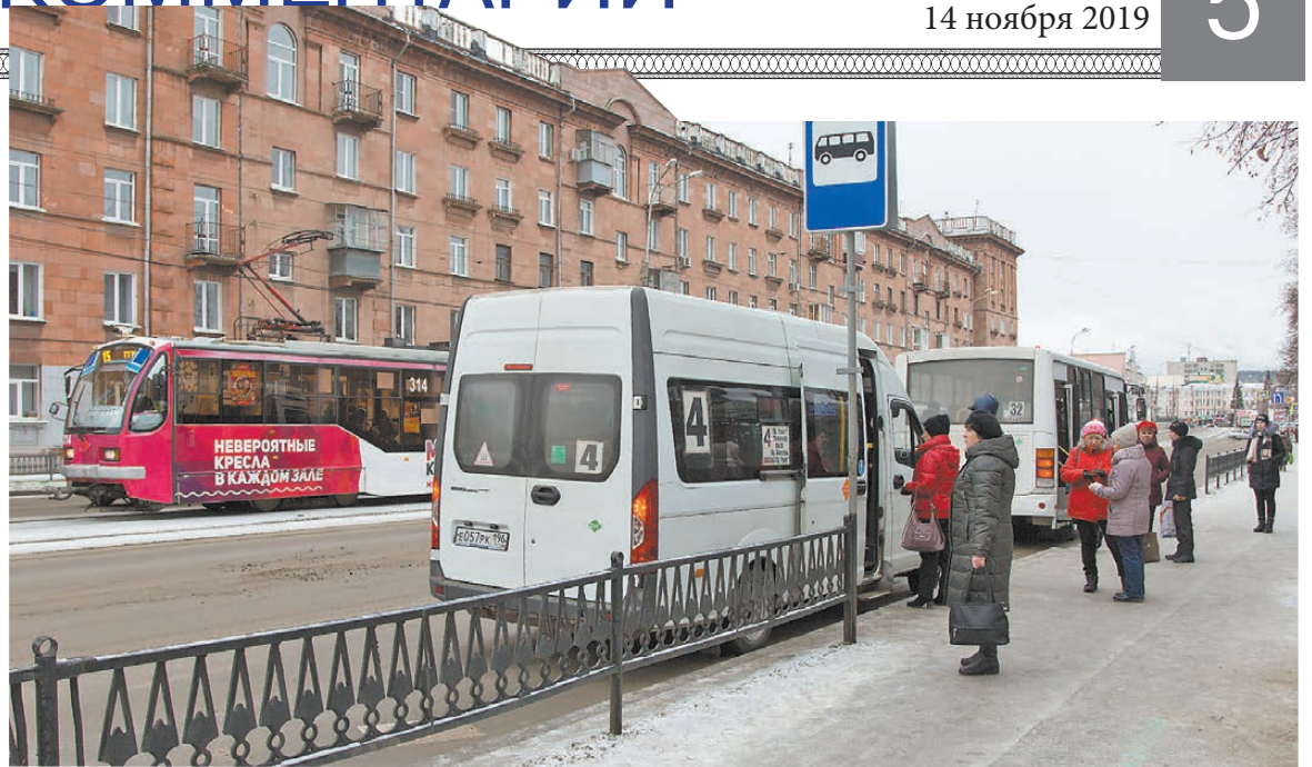
Трамвай, маршрутка и ПАЗ – три главных героя прошедшей встречи.

С этого года в городском транспорте должны обязательно устанавливаться тахографы, которые отслеживают режим труда и отдыха водителей. С ними предприятие автоматически получит штраф, если шофер будет