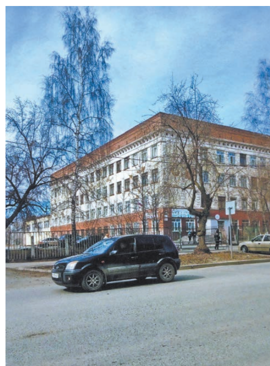
Современная школа №33.