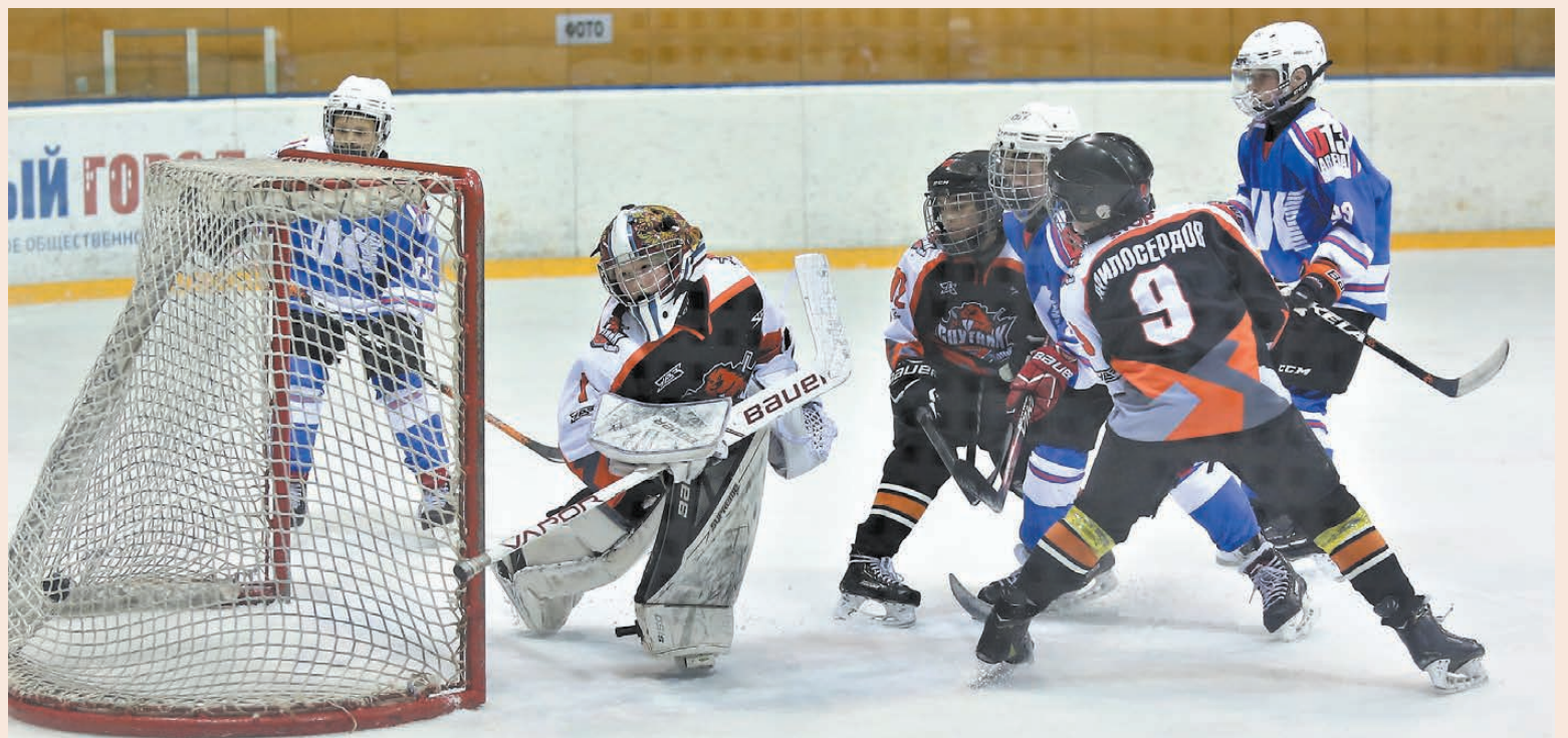
«Спутник» против «Кристалла-Юпитера». Шайба – в воротах вагонской команды.

На тагильском льду прошел первый тур отборочных соревнований первенства России среди команд игроков 2008 года рождения.