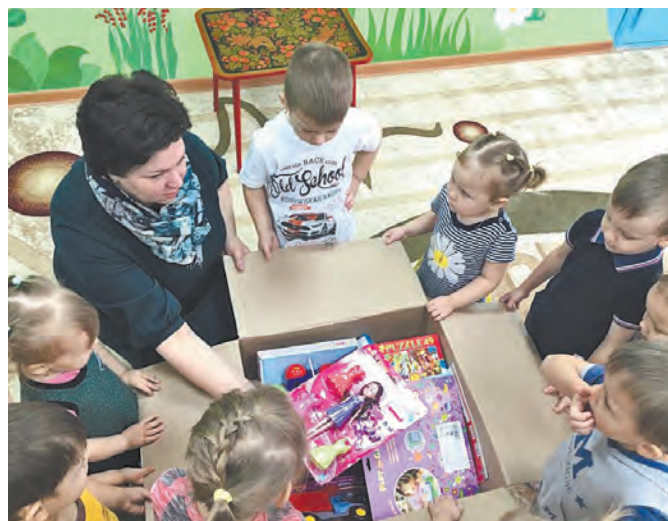
Детский сад «Елочка»

На сегодняшний день волонтерский отряд объявил о начале новой благотворительной акции «Новогодний сюрприз». Ведь Новый год - это праздник, который дети и взрослые связывают с подарками и исполнением желаний. Испытать радость