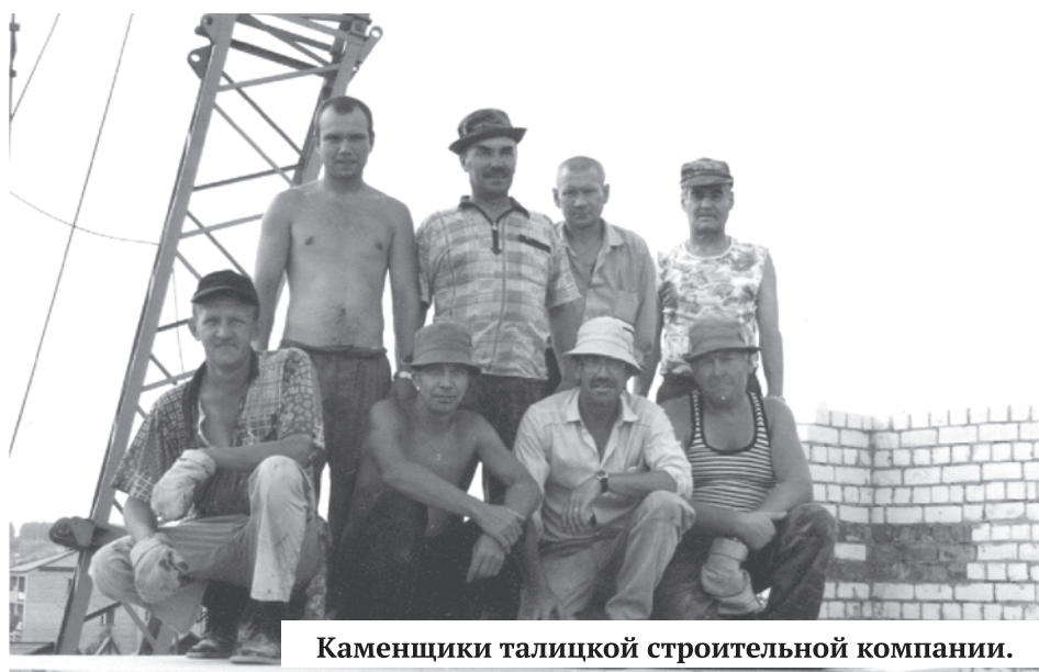
Каменщики талицкой строительной компании.