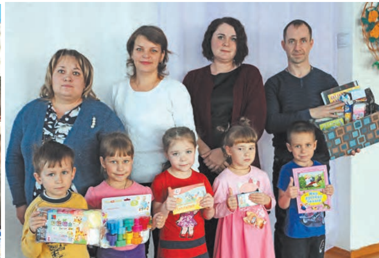
Подарки от детского сада «Тополёк»

Доброе дело сделал и коллектив детского сада №2 «Солнышко». Вместе с фельдшерами дошкольно-школьного отделения Талицкой ЦРБ, воспитанниками и их родителями они собрали вещи для детей, находящихся в Социально-реабилитационном центре для несовершеннолетних по Талицкому району. Свою акцию они назвали «Добрые дела» и приурочили ее к мероприятию «10000 добрых дел». Вместе с вещами дети положили в пакеты игрушки, тетради, пластилин и краски.