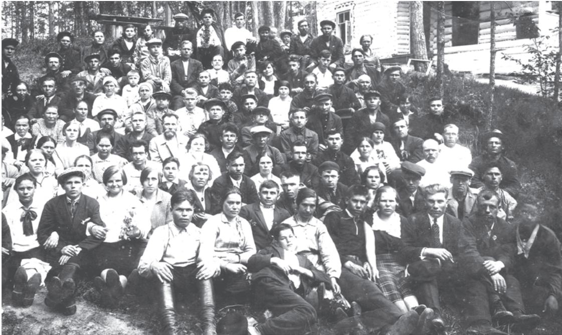
1941 год. Первый призыв на Великую Отечественную войну в саду Поклевского.