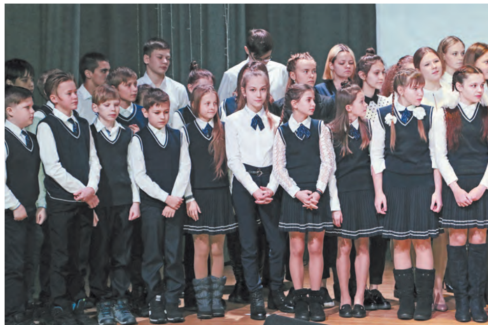
Волонтеры из школы №1, г. Талица