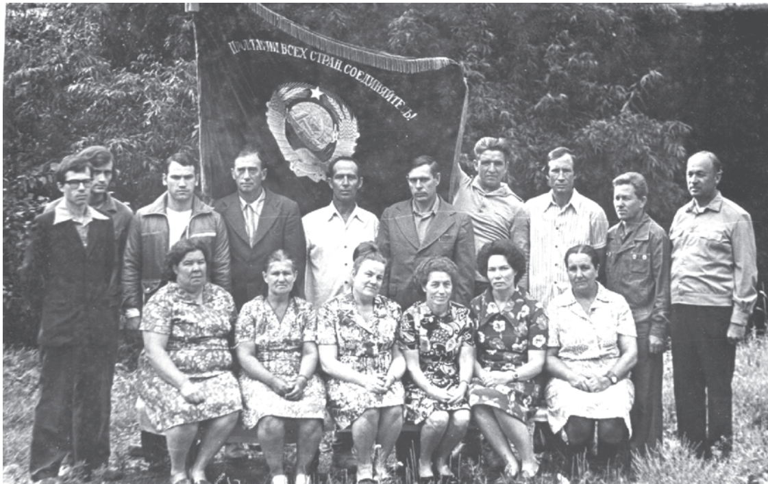
70-е годы прошлого века. Бригада углекислотного цеха завода БХЗ.

Каждая фотография должна сопровождаться информацией о том, когда и где она сделана, что на ней изображено (или кто изображен), от кого получена.