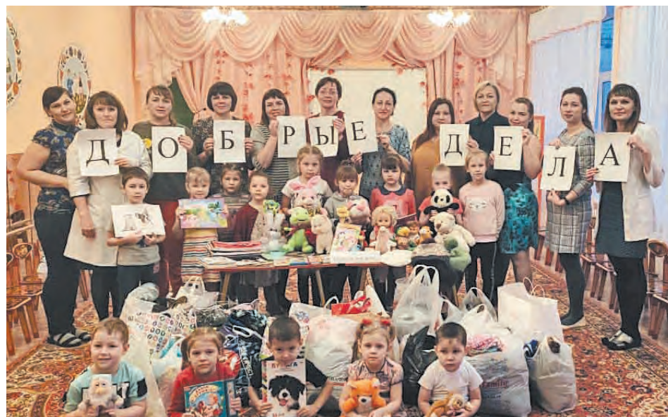
Детский сад №2 «Солнышко»