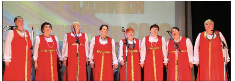
Ветеранская группа «Еще не вечер» (Ретнева).