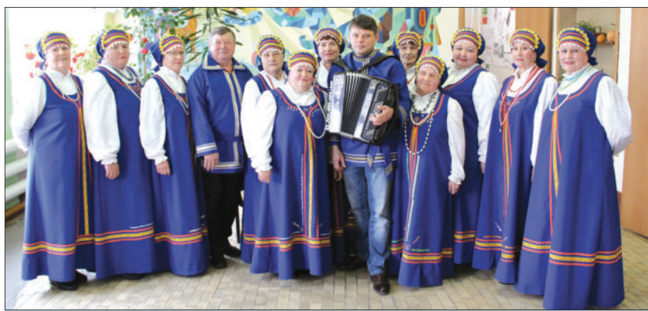
Вокальная группа «Харловские посиделки» в своей песне «Мое любимое село» завила всех зрителей и гостей фестиваля, что останется в Харловском навек.