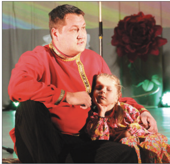
Ансамбль «Бабье лето» (д. Фомина).