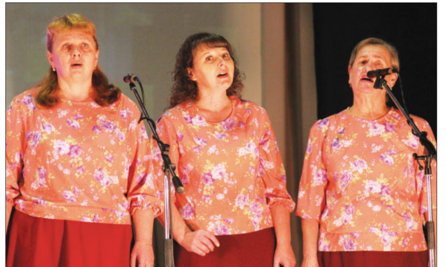
Большекочевский вокальный коллектив «Селяночка».