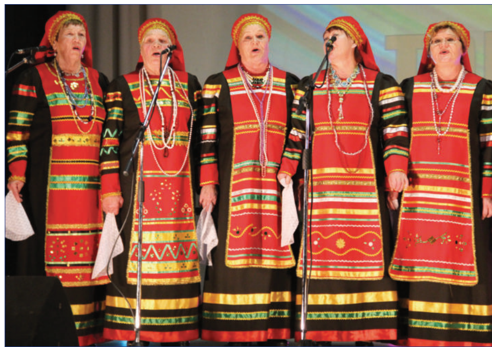
Ансамбль «Бабы лето» Фоминской ветеранской организации.