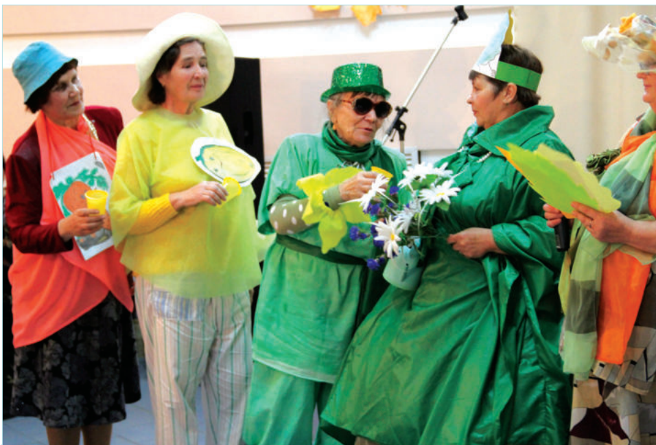
Речаловский ветеранский коллектив «Вечора».