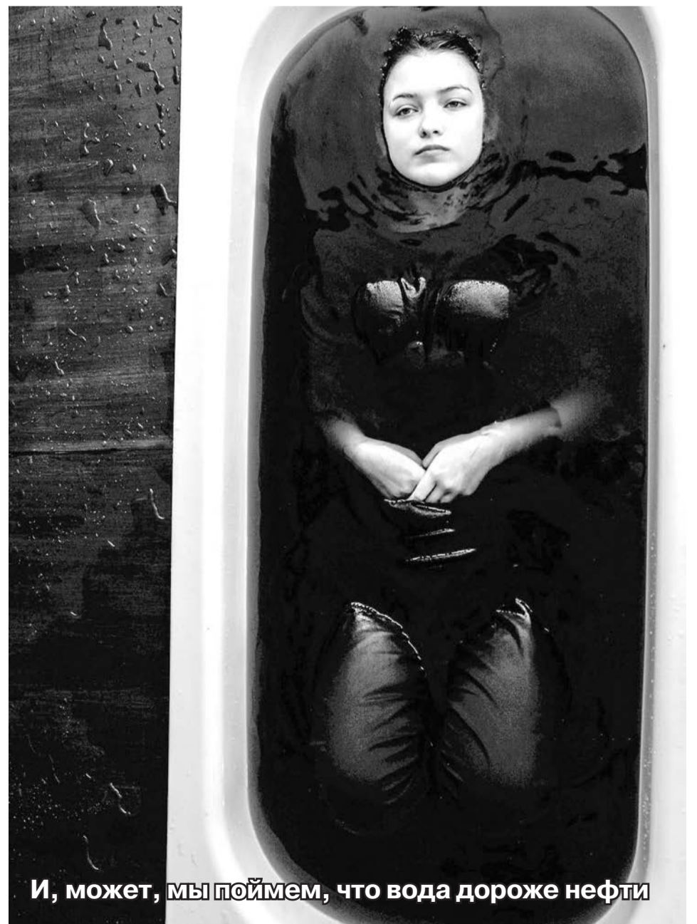
И, может, мы поймем, что вода дороже нефти