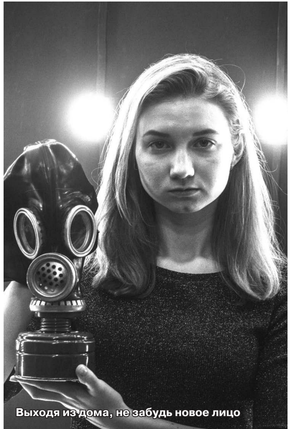
Выходя из дома, не забудь новое лицо