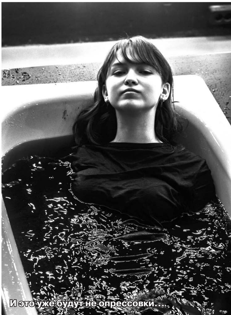
И это уже будут не опрессовки....