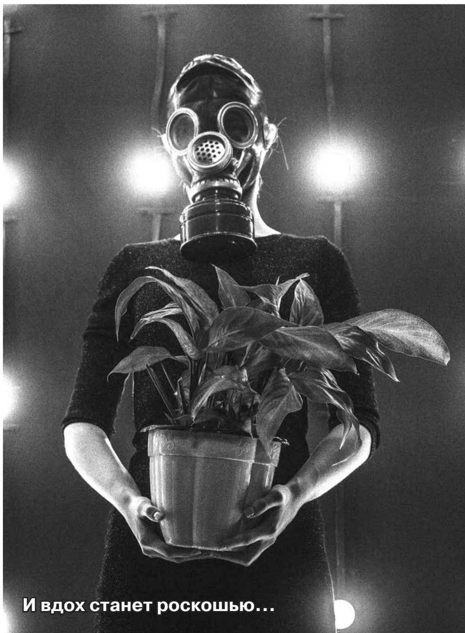
И вдох станет роскошью...