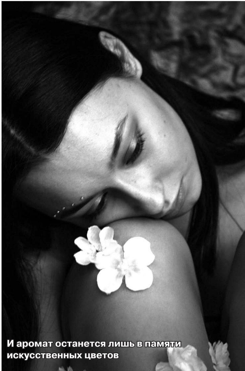
И аромат останется лишь в памяти искусственных цветов