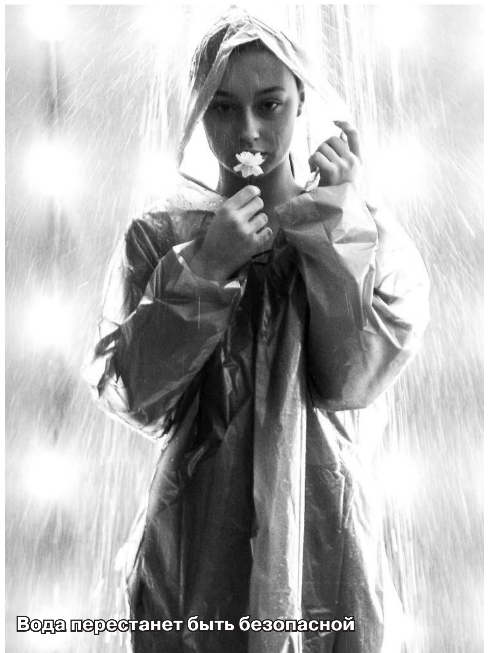
Вода перестанет быть безопасной