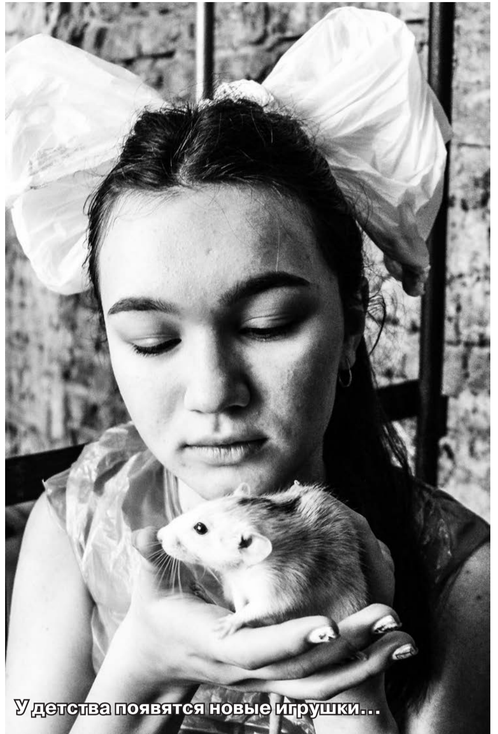
У детства появятся новые игрушки...