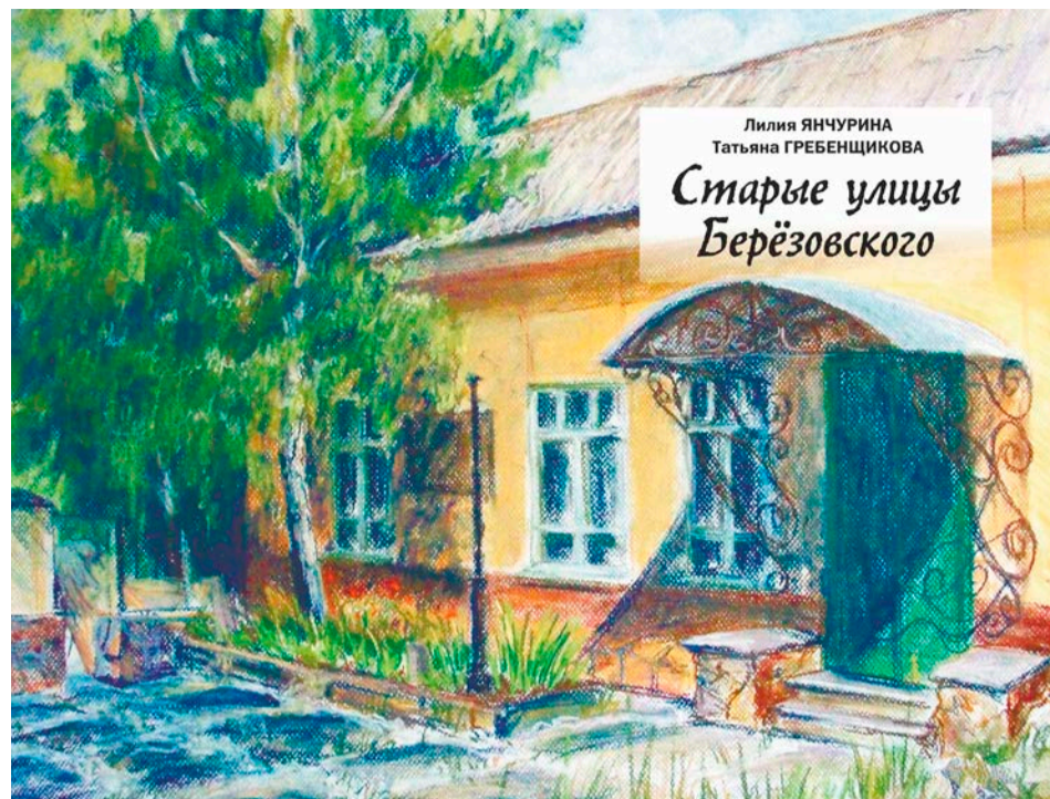
200-страничный иллюстрированный сборник появится на свет благодаря финансовой поддержке фонда «Благо», субсидиям администрации города и музея «Русское золото»