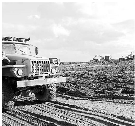
Подготовительные работы по рекультивации свалки начались летом этого года.

По данным Минприроды РФ, свалка давала 12 процентов от объема всех выбросов в атмосферу Челябинска. ●