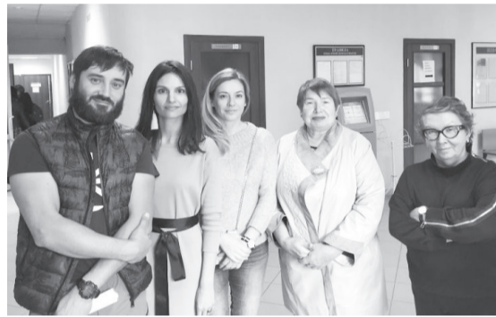
Жители таунхаусов в «Николином ключе» празднуют победу

Но есть одна печальная новость: «Николин ключ» может обжаловать решение сысертского суда в областном суде. Подождем.