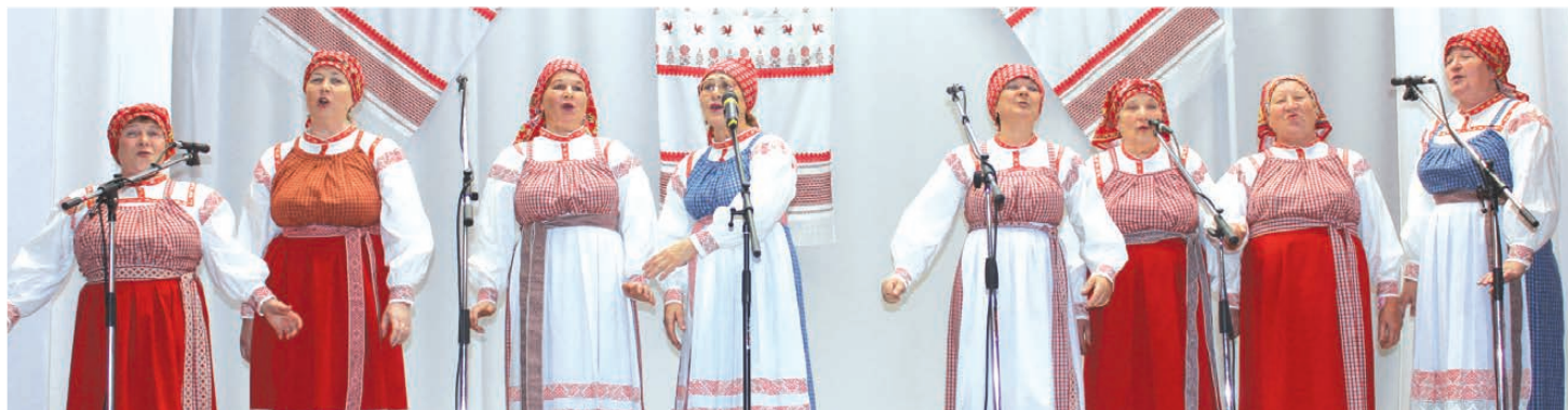
Вокальная группа «Журавушка» Ницинского СДК.