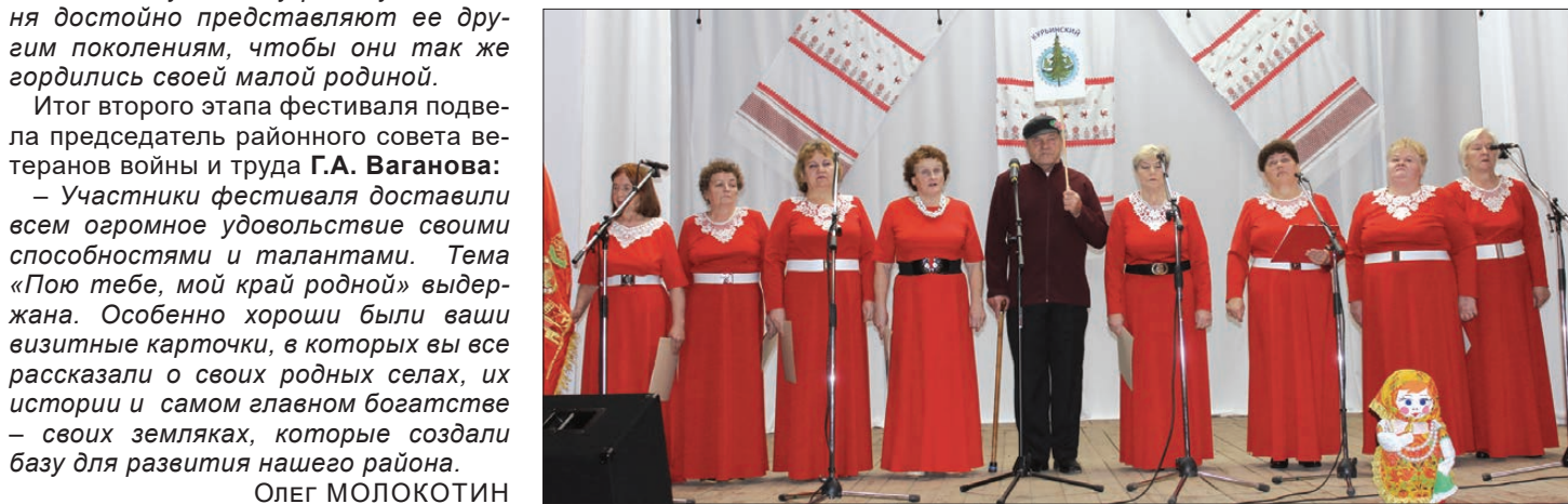
Ветеранский коллектив «Уральская рябинушка» Курьинского ДК.