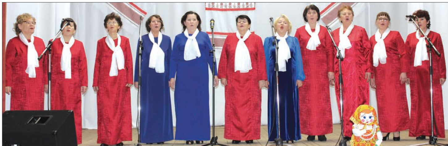
Женский клуб «Зоренька» Ключевской ветеранской организации.

Все эти рассказы о родном крае и России дополнялись песнями и сти-