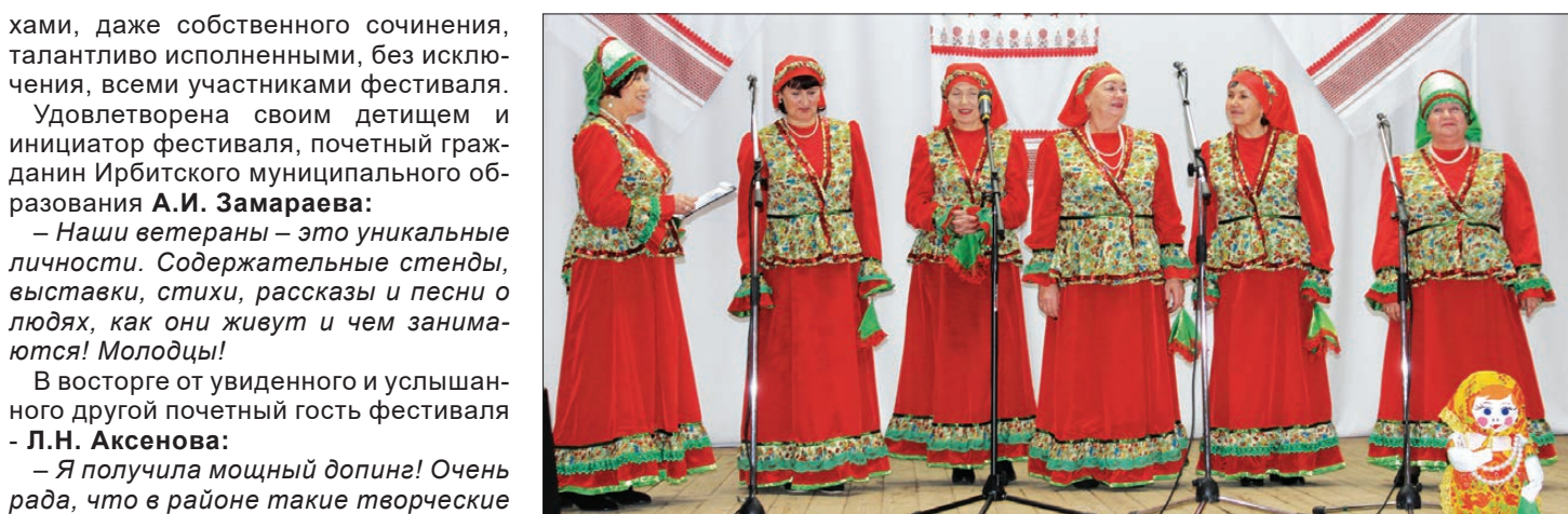
Ветеранский клуб «Журавушка» (д. Бердюгина).