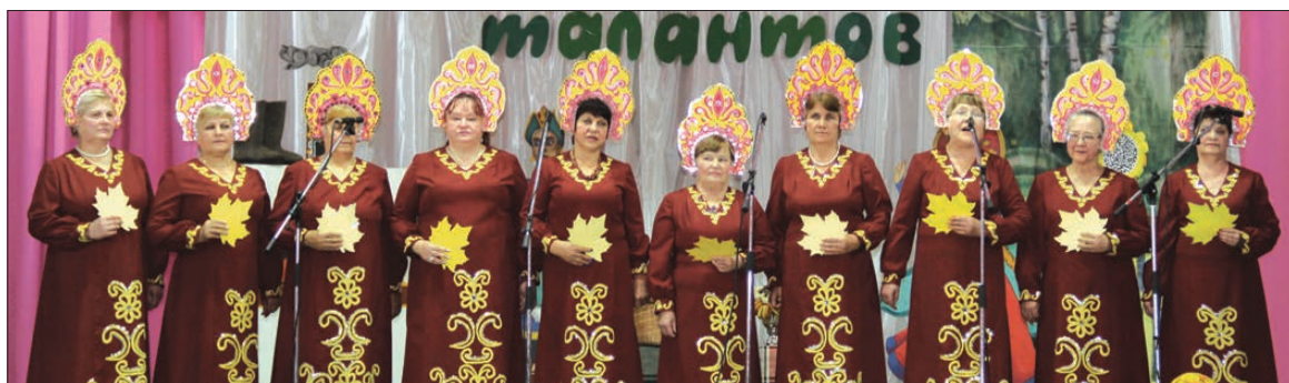
Фольклорная группа «Сударушка» (с. Горки).