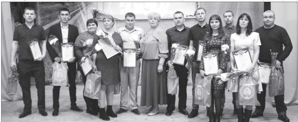
Перспективная молодежь сельского хозяйства Ирбитского района.