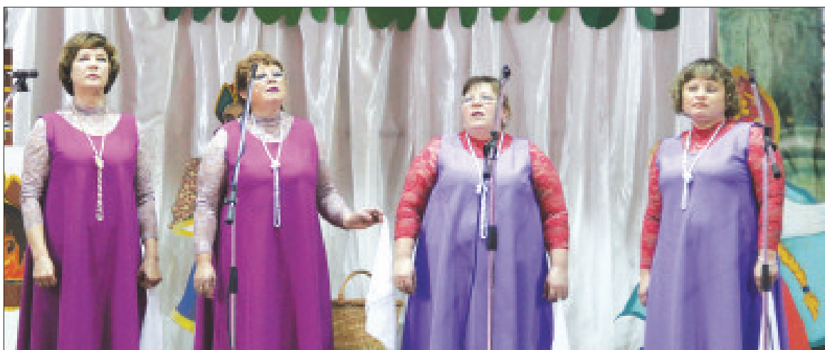
Группа «Селяночка» Лаптевской ветеранской организации.