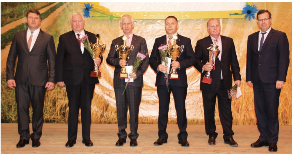
Руководители предприятий-флагманов сельского хозяйства Ирбитского района.