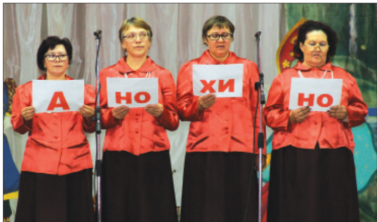
Анохинская сельская библиотека.

- Вы делаете все на благо района, чтобы он процветал, вносите огромный вклад в социальное развитие, учите и помогаете нашей молодежи. Вы передаете нам свои знания, делитесь накопленным опытом и, конечно, радуете своим творчеством. Труд ваш неocenim и очень важен для