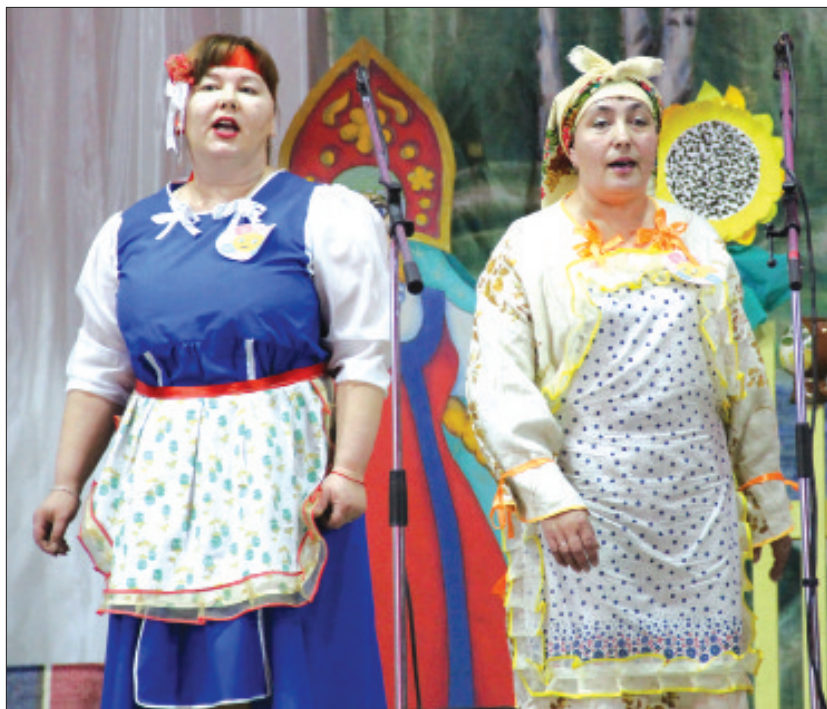
Ветеранский коллектив «Благодея» (д. Якшина).