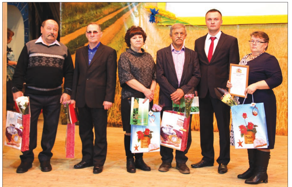
Обладатели высоких региональных наград.