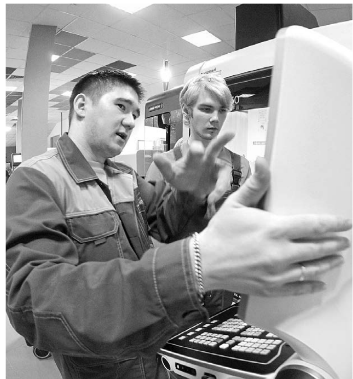
Современный наставник зачастую ненамного старше своего подопечного, но уже достиг мастерства и готов делиться опытом.