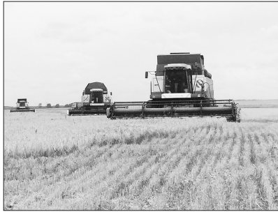
Уборка зерновых в ПАО «Каменское»

В Каменском районе зерновые убраны в полном объеме, в этом сезоне намолочено в бункерном весе 34,7 тыс. т, урожайность – 22,8 ц/га (в 2018 г. – 20,4 ц/га). Валовое производство картофеля составило 37,7 тыс. т при средней урожайности 150 ц/га. Произведено 3 тыс. т овощей, 2,2 тыс. т технических культур.