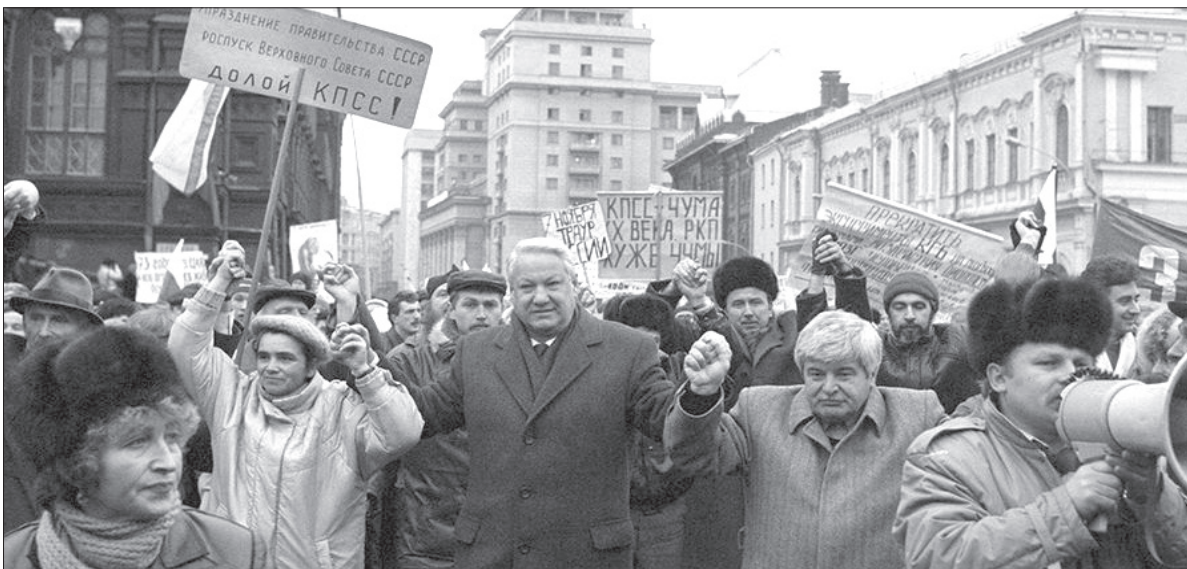
Митинг-демонстрация 7 ноября 1991 года

«Я ушла из детства в грязную теплушку, В эшелон пехоты, в санитарный взвод. Дальние разрывы слушал и не слышал Ко всему привыкший сорок первый год», – напишет она.