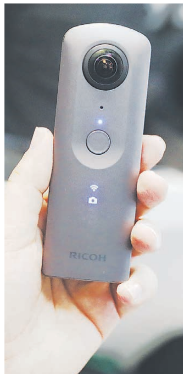
Простенькая, на первый взгляд, маленькая камера способна вести съемку с обзором 360 градусов.

— Случай был в Башкортостане. Молодая женщина забеспокоилась: подругу давно не видно, дома не появляется, на звонки не отвечает. Соседка пошла в правоохранительные органы. Приехавшие сотрудники полиции обнаружили, что глава семьи покончил с собой, а матери и несовершеннолетних детей нет. Стало понятно: все пропавшие, пять человек, скорее всего, мертвы. А сообщить, где тела, некому — предполагаемый убийца повесился. Сыщики и следователи Башкирии перекопали огород, разрыли выгребные ямы, обыскали все заброшенные постройки. Однако тела так и не нашли. На помощь выехали мои сотрудники, как в учебнике, посмотрели на место глазами преступника, попробовали погрузиться в его мысли. Мы использовали ту же информацию, что и башкирские коллеги, только пропустили ее через призму следственного опыта, криминалистической науки, возможности нашей техники. И на том же огороде обнаружили заполненный водой и грунтом колодец, замаскированный мусором. Расчистили его, спустились, расковыряли ледяную грязь и вытащили тела всех пятерых пропавших.