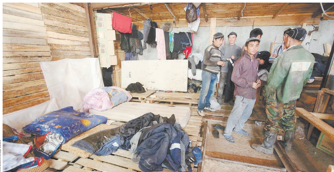
Большинство мигрантов живет и работает в одном месте.

В полиции мой случай с фиктивно прописанными мигрантами назвали «нестранным». Но заявление приняли, пообещав дать ответ дней через десять. По сути, я хочу узнать, возбудят ли полицейские уголовное дело и рискнут ли искать призраков, прописавшихся в нашем доме.