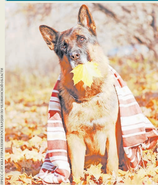
ПРЕСС-СЛУЖБА УПРАВЛЕНИЯ РОСТВАРДИИ ПО ЧЕЛЯБИНСКОЙ ОБЛАСТИ