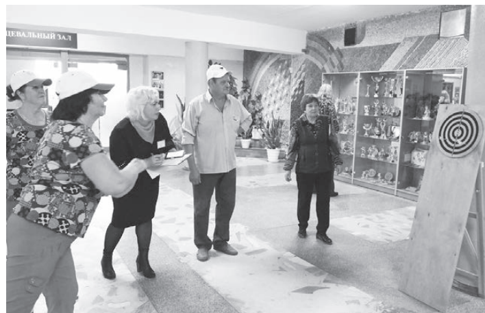
Дротики - точно в цель!