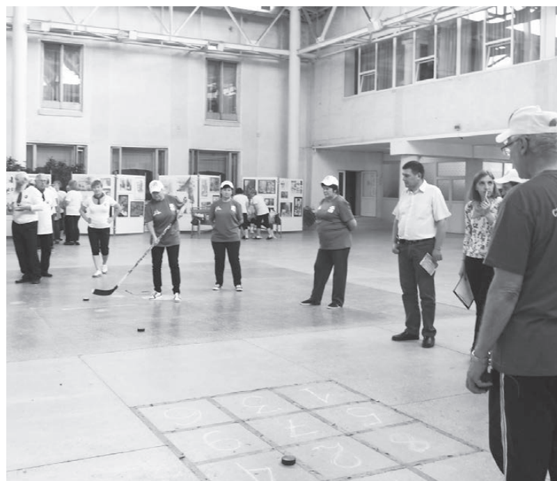
Трус не играет в хоккей!