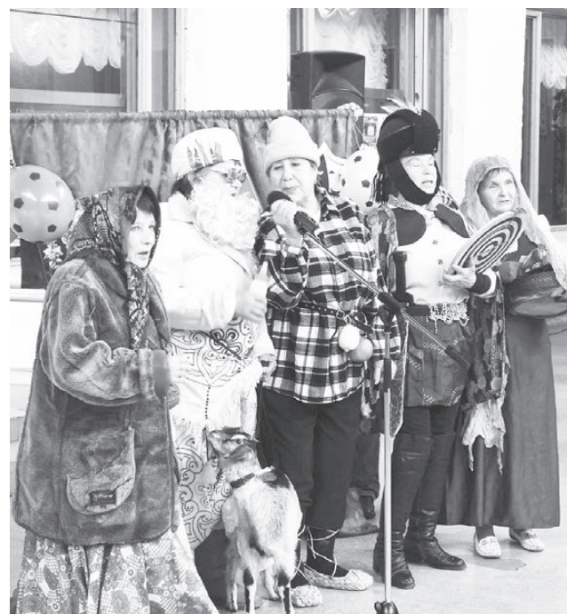
Шестая в команде - коза!