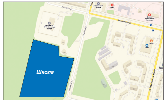
Школа будет на Спортивной—Интернационалистов.