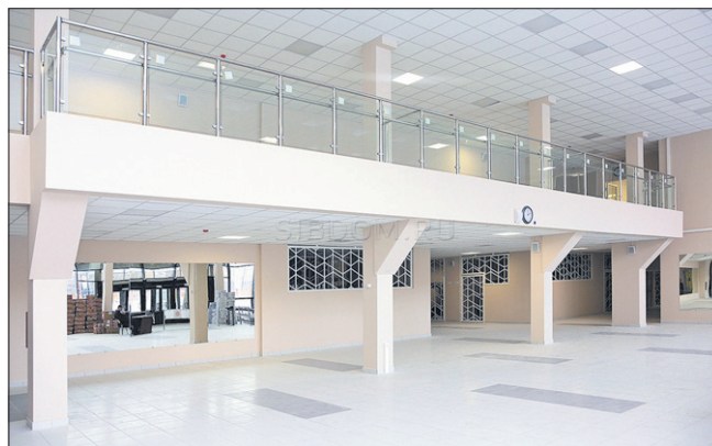
Большое светлое фойе.