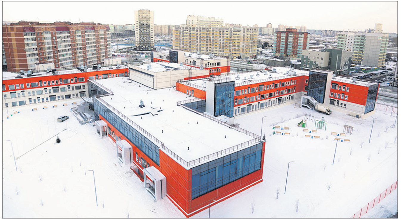
Вид с высоты на здание школы в Красноярске.

Школы по красноярскому проекту работают в Сибири, и мы можем на их примере посмотреть, какой будет новая школа в Ревде.