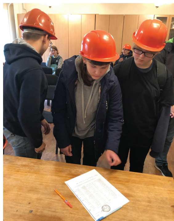
Инструктаж по технике безопасности пройден.

бята обсуждают и обмениваются мнениями об увиденном. Учащиеся создают фотоколлаж, выпускают стенгазету с фотографиями, чтобы показать и заинтересовать других ребят.