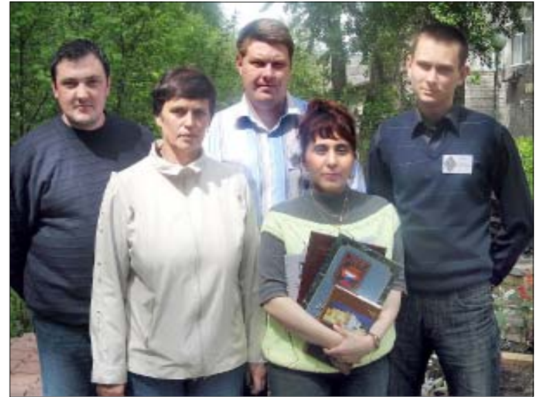
4 июня 2008 года. Победители заводского конкурса по охране труда - команда цеха №1.

Затем конкурсанты перешли к практической части. Один из участников команды становился "пострадавшим", остальные - оказывают первую помощь. Познания в области медицины иногда бывают необходимы. Начальник службы