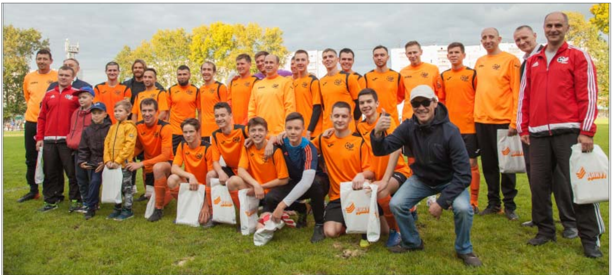
Товарищеский матч окончен. Настроение отличное!

Репортаж со стадиона вели Екатерина ТОКАРЕВА и Лариса ОГЛОБЛИНА