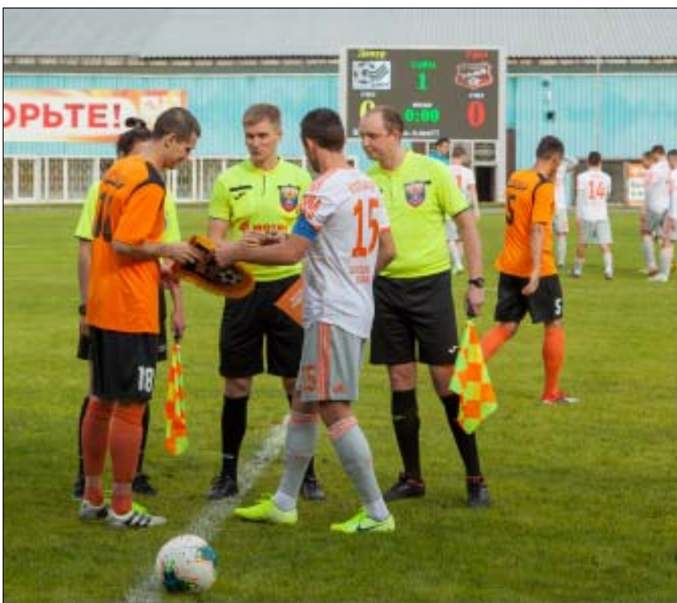
Обязательный ритуал приветствия капитанов и судей.