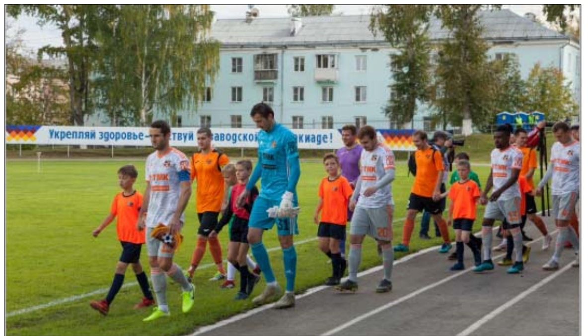
За руку - с кумирами.