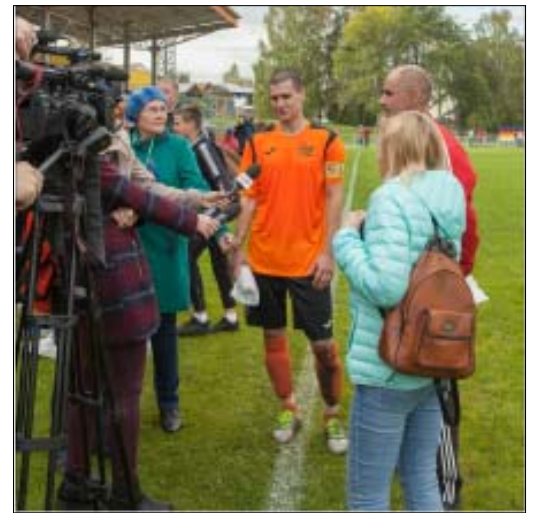
Несколько вопросов - капитану и тренеру «Динура».

окончен, но расходиться болельщики не спешили. Ребятишки фотографировались у большого фирменного автобуса "Урала", брали автографы у футболистов, взрослые обсуждали увиденное.