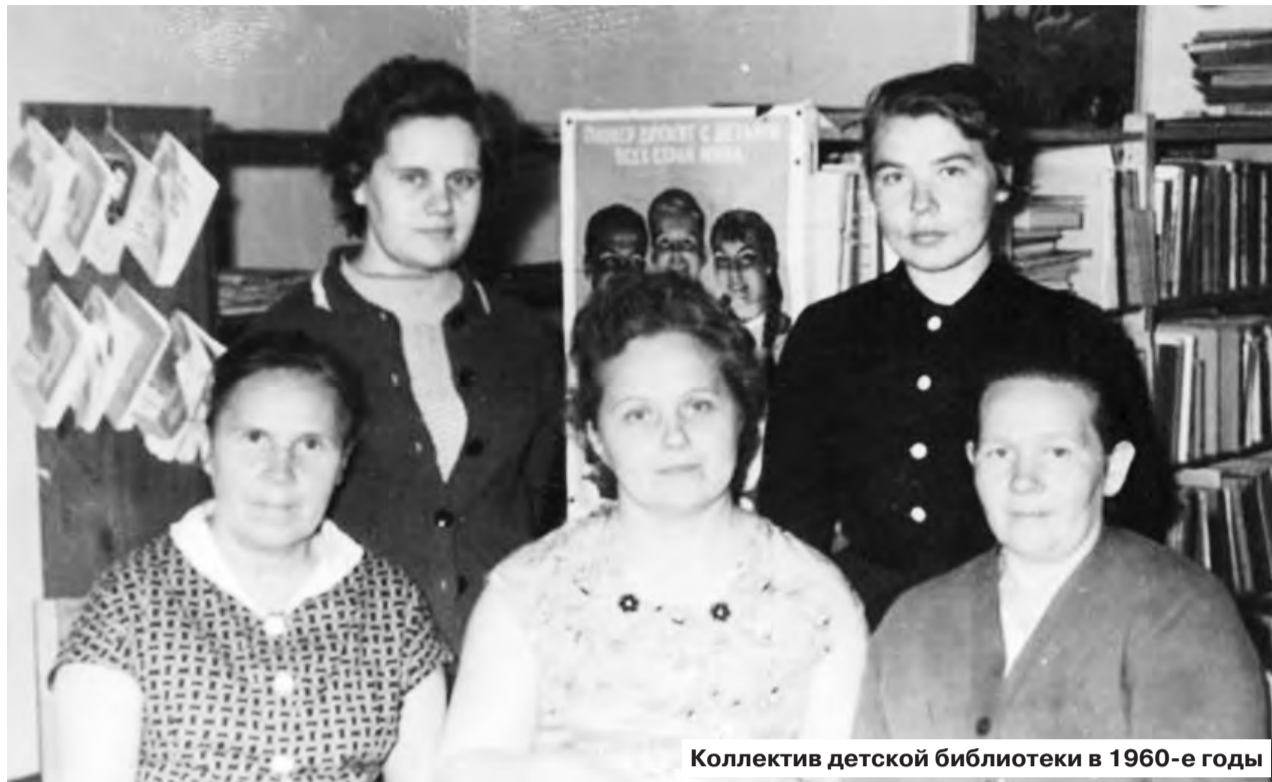
Коллектив детской библиотеки в 1960-е годы