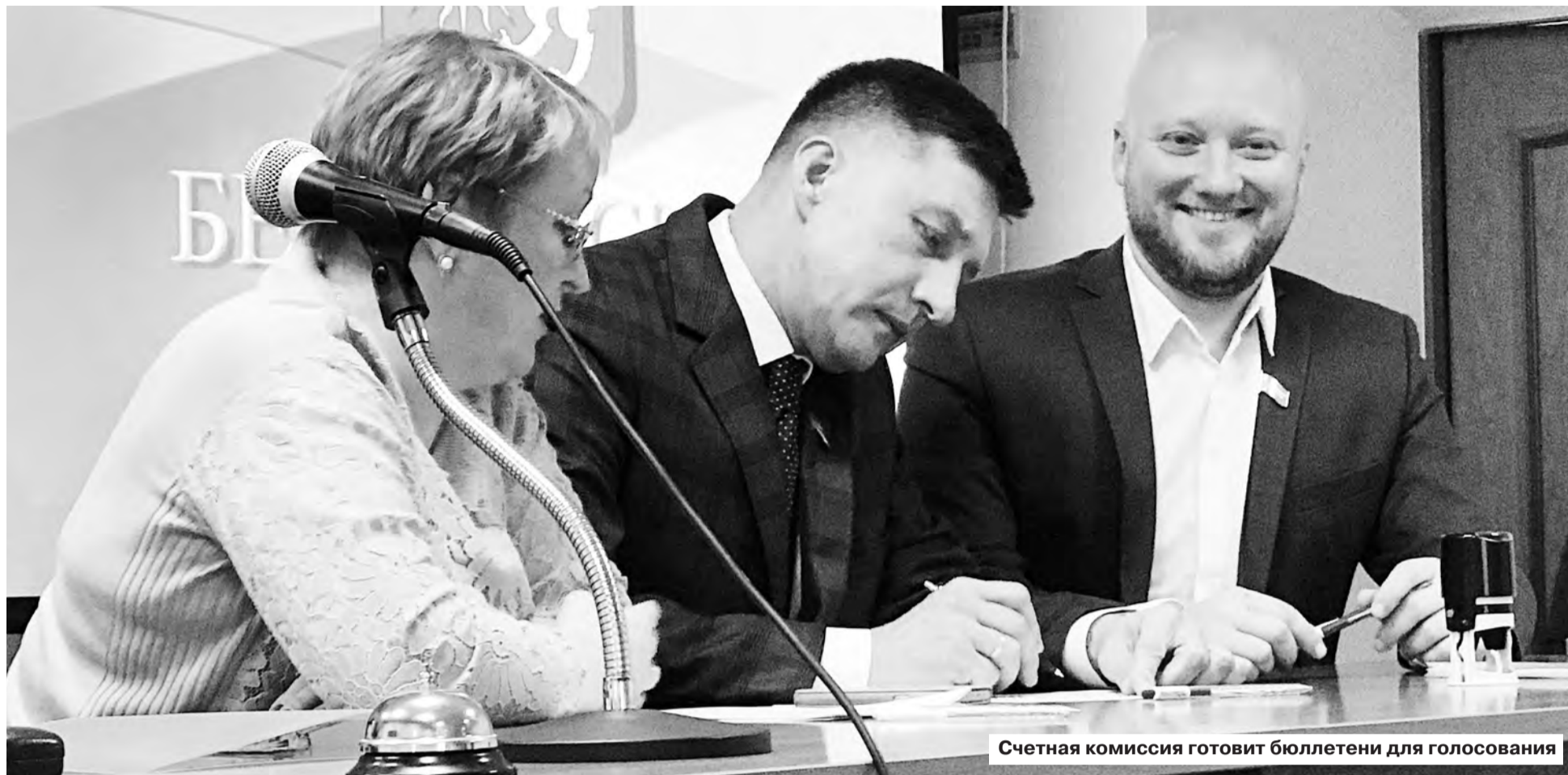
Счетная комиссия готовит бюллетени для голосования