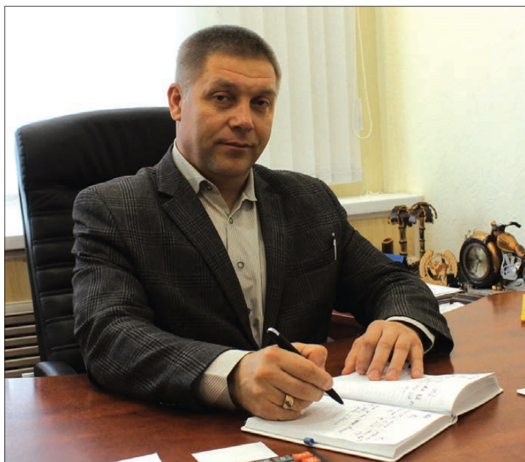
Рекордный урожай нынешне-го года для СПК имени Жукова – закономерность.

В конце сентября в Ирбитском районе в числе первых завершил уборочную кампанию СПК им. Жукова. Год для хозяйства был не самым легким в связи с погодными условиями, но, тем не менее, самый урожайный.