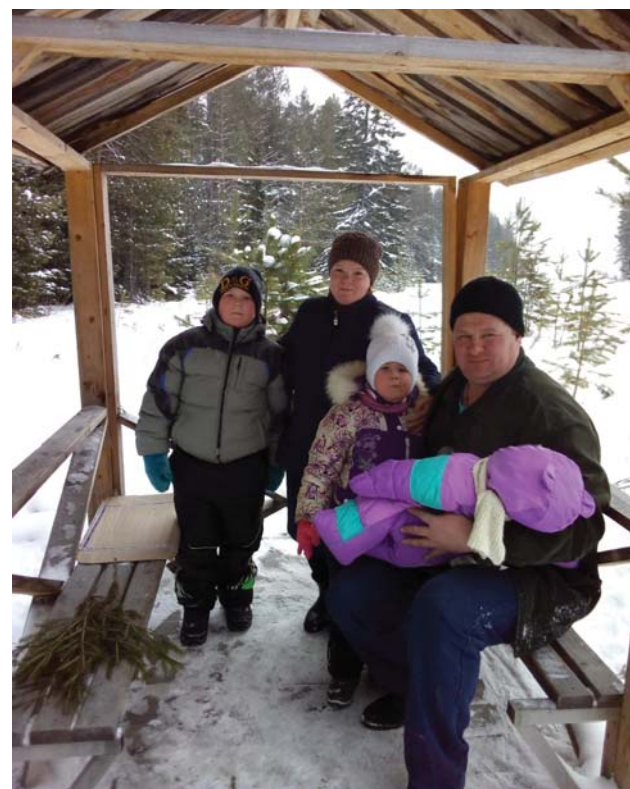
Счастье, когда вся семья вместе.