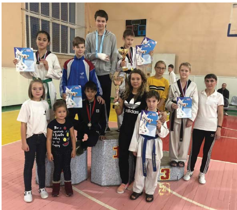
Сборная Первоуральска - на третьем месте

Команда Первоуральска заняла третье место в общем зачёте. Секцию тхэквондо заводского спорткомплекса представляли семеро воспитанников. В