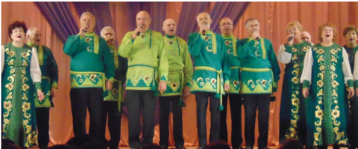
Хор «Россияне» - с премьерой.