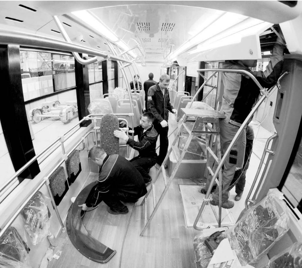
Екатеринбургские трамваи последних моделей отличает эргономичность и комфортность салона.