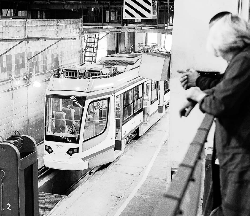
УКВЗ сейчас переживает не лучшие времена. Заказ Челябинска мог бы поддержать предприятие.

Так неожиданно комплектующая бросила тень на все изделие, вынужденное уже около месяца стоять на приколе. Во время рабочих рейсов пассажиры отмечали также навязчивое поскрипывание внутри салона. Что тому причиной и можно ли устранить эти не слишком ласкающие ухо звуки, производители не ответили. В общем, начало испытаний про-