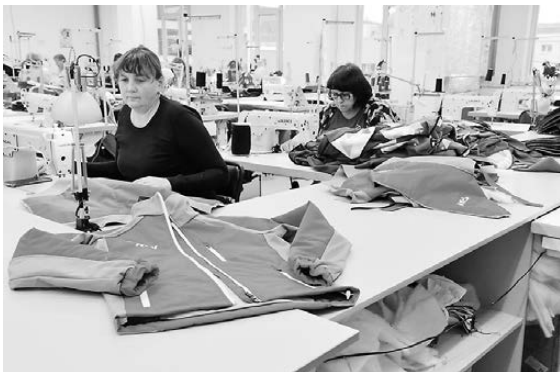
Спортиную одежду, сшитую в столице Урала, будут поставлять в 52 страны мира.