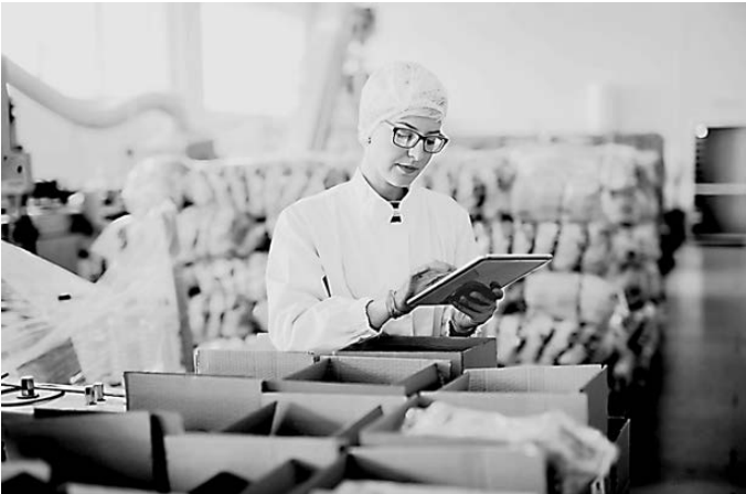
Дополнительная фасовка и доставка товаров, заказанных по Интернету, неизбежно увеличивает их конечную цену.