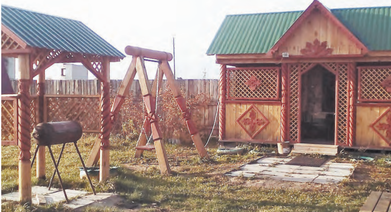
Деревянный ансамбль во дворе мастера