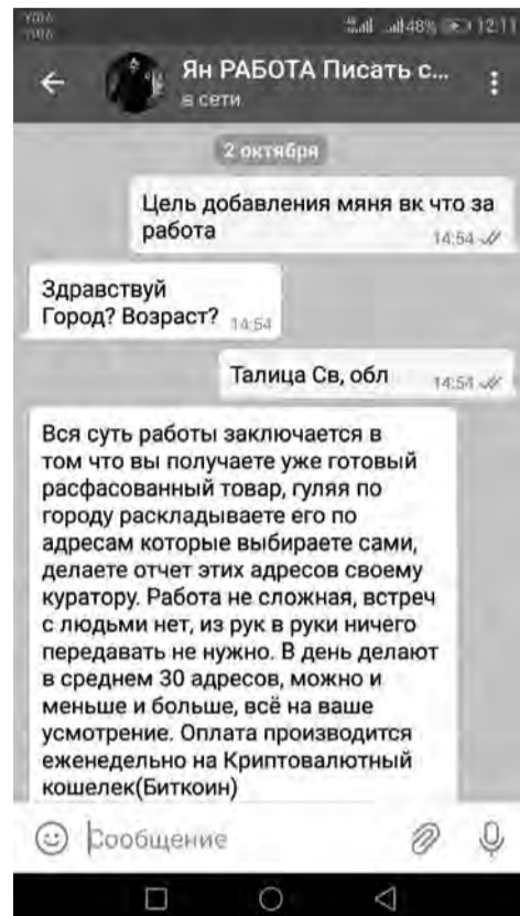
Скрин переписки ВК

В одной из популярных талицких сообществ буквально на несколько минут появилось объявление о том, что в Талице требуется закладчик. Появилось и было удалено. Но ведь нашлись те, кто зацепился взглядом. Великий и могучий, нет, уже не русский язык, - интернет. Глобальная сеть, зашифрованные каналы и сайты, которые удаляются в течение нескольких часов. Здесь вся информация где, что и почем. Все это доступно и в провинции, если есть спрос. «Вконтакте» предлагается дополнительный заработок, а затем «разговор» переходит на площадку Телеграмм-канала, который полностью закрыт для правоохранительных органов, как бы не хотели надзорные ведомства его ликвидировать. В чате без всяких секретов, честно и понятно соискателям объясняется, что в нашем городе требуются закладчики курительных смесей, так называемые кладмены, и чем больше, тем лучше. Ведь, чем больше закладок, тем выше заработок... Обещают до 50-70 тысяч рублей в месяц.