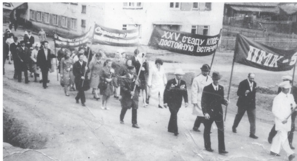
ПМК-5 на демонстрации в 1975 году.