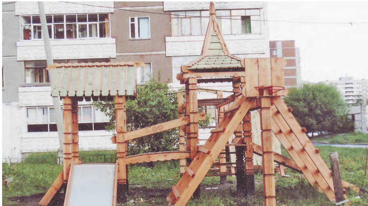
Детская дворовая площадка

резчика. И от того, насколько чутким мастером он является, зависит чистота, тепло и красота будущих творений.