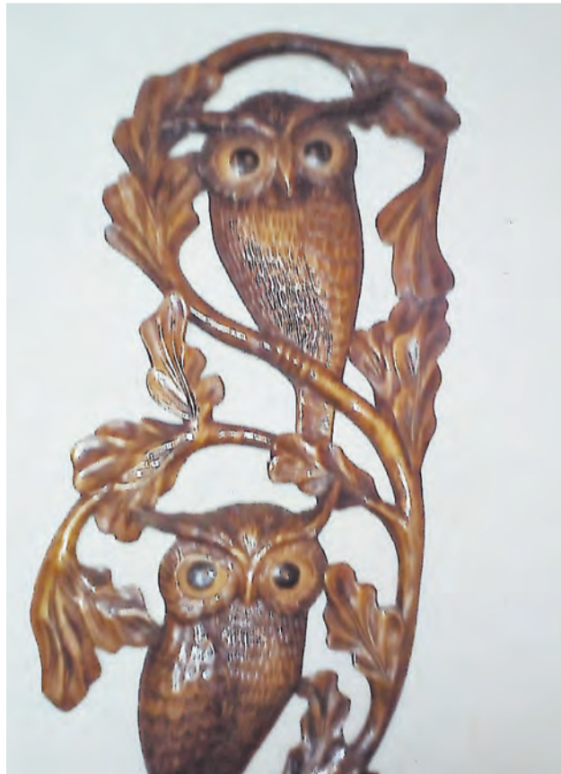
Панно из дерева

Дерево – уникальный дар природы, нечто живое и удивительное. Говорить с ним и слышать его, преобразуя в новые формы – безусловно, вот задача