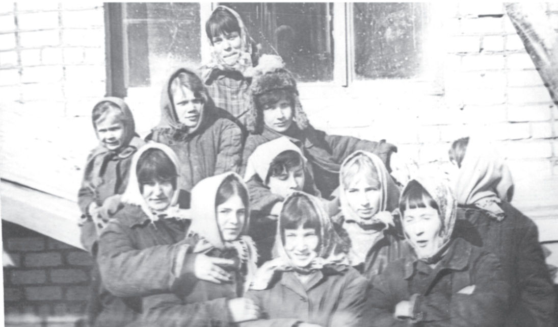
1971 г. Строительная бригада ПМК-5.