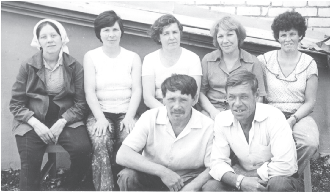
Бригада ПМК-5 на строительстве стоматологической поликлиники.

Каждая фотография должна сопровождаться информацией о том, когда и где она сделана, что на ней изображено (или кто изображен), от кого получена.