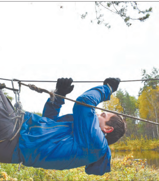
на курсе выживания в лесу. Безусловно, вызывает у людей восторг, но и имеет свои минусы