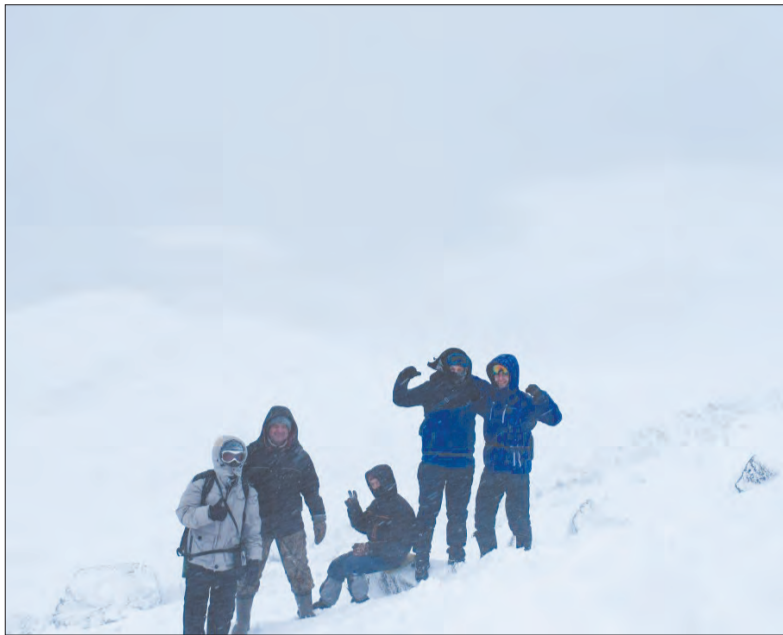
Поход на самую высокую гору Свердловской области – Конжаковский камень в ноябре прошлого года, достаточно суровые условия при подъеме на вершину. Сильнейший ветер, снег, холод – настоящие испытания