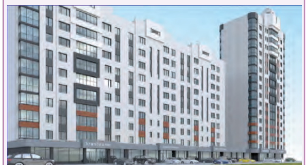
Агентство «Квартал». Тел. 8-908-910-37-95