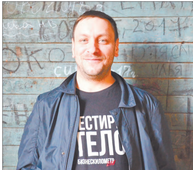
Туристическая поездка выходного дня, ГЭС «Пороги» в Челябинской области (где-то в районе г. Сатки), сентябрь 2019 года