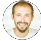
ПОДГОТОВИЛ ДМИТРИЙ КОРШУНОВ

Частичную компенсацию затрат на приставки, антенны или комплекты для приема «цифры» могут получить малоимущие семьи и одинокие люди, чей доход не превышает величины двух прожиточных минимумов Свердловской области. Также летом был расширен перечень льготных категорий. Теперь на компенсации могут рассчитывать ветераны Великой Отечественной войны, в том числе труженики тыла, супруги умерших инвалидов и участников Великой Отечественной войны, совершеннолетние и несовершеннолетние узники нацистских концлагерей и гетто.