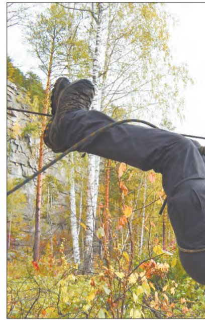
☑ Навесная переправа через реку Реж. Прохождение подобных препятствий, безусловно, приносит много положительных эмоций и впечатлений.