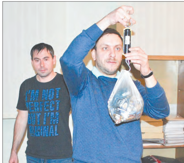
Взвешивание батареек перед отправкой на перерабатывающее предприятие в Челябинск, декабрь 2017 года

Он – активный участник городского эконообщества, автор проекта городского парка на месте шахтного провала, один из организаторов общественной инициативы «Питомник деревьев», администратор группы «Удобный Берёзовский» в социальной сети «ВКонтакте». В 2016 году участник избирательной компании в Думу Берёзовского.