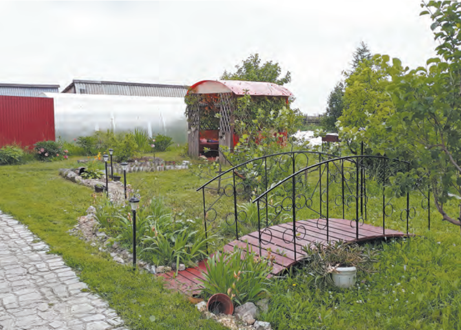
Центральная часть усадьбы

В традиционном районном конкурсе «Лучшая сельская усадьба, село, деревня-2019» приняла участие 17 усадеб и 18 территорий.