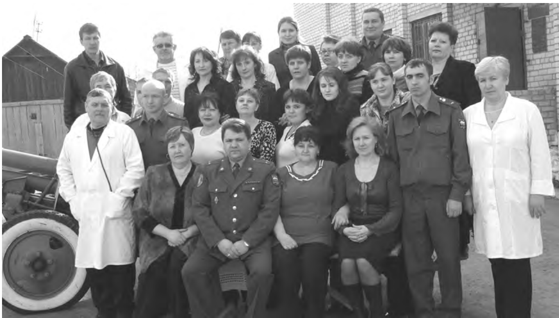
2008 г. Коллектив военкомата. г. Талица.

Каждая фотография должна сопровождаться информацией о том, когда и где она сделана, что на ней изображено (или кто изображен), от кого получена.