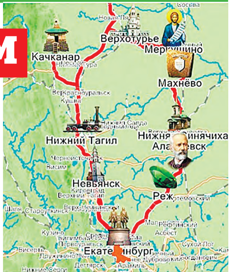
Эта карта Серебряного кольца Урала опубликована на сайте министерства культуры, спорта и туризма Свердловской области

До начала проектирования СКМ следовало бы