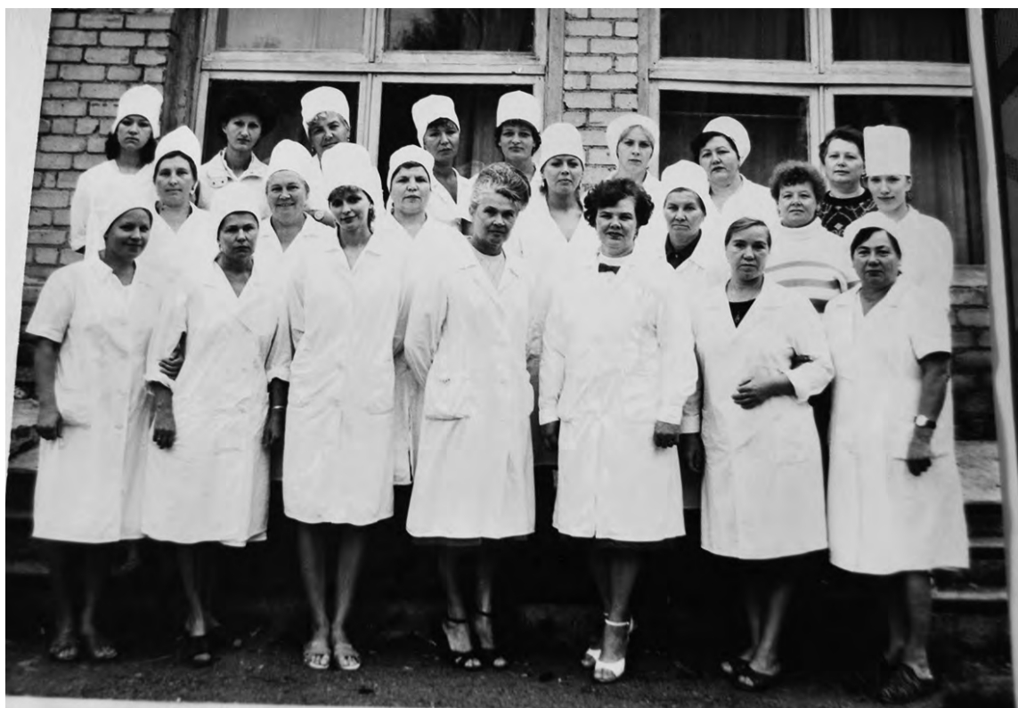
Коллектив акушерского отделения, 1980-е годы

ция, и маршрутизация. Слова-то какие придумали. А мне кажется, что это просто развал медицины — и больше ничего. Если не назвать это вредительством, — считает опытная акушерка. — Вот последние события, о которых вы рассказывали в газете. Я хоть уже 18 лет не работаю, но у меня болит душа о производстве. Соединить родильное отделение, гинекологию, абортниц и палаты новорожденных — это неприемлемо. Раньше санэпидстанция нас строго контролировала. Анализ брали всё время, проверки устраивали. А теперь что, всё можно, получается?